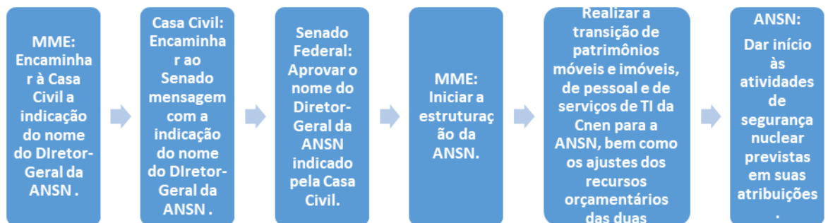
Figura 2 - Fluxo do processo com as atividades necessárias para a implementação da ANSN

164. Nesse cenário, deve-se proceder com a maior brevidade a nomeação do Diretor-Geral da ANSN, seguindo as etapas descritas no fluxo da Figura 2, para que a Autoridade seja implementada.