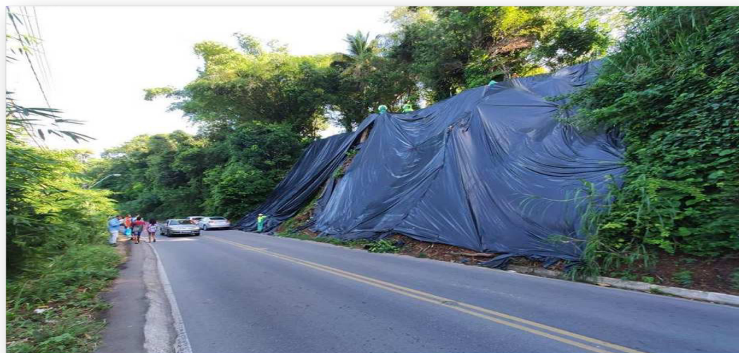
Figura 04 – Encosta com proteção da lona plástica

Em função da ocupação irregular e da falta de saneamento básico (abastecimento de água, sistema de esgoto e drenagem), há constantes erosões e, consequentemente, desabamentos, ocasionando eventuais. As erosões também são causadas pelo tipo de solo arenoso que é predominante nestas áreas, potenciais geradores de riscos de desabamentos (Figura 5).