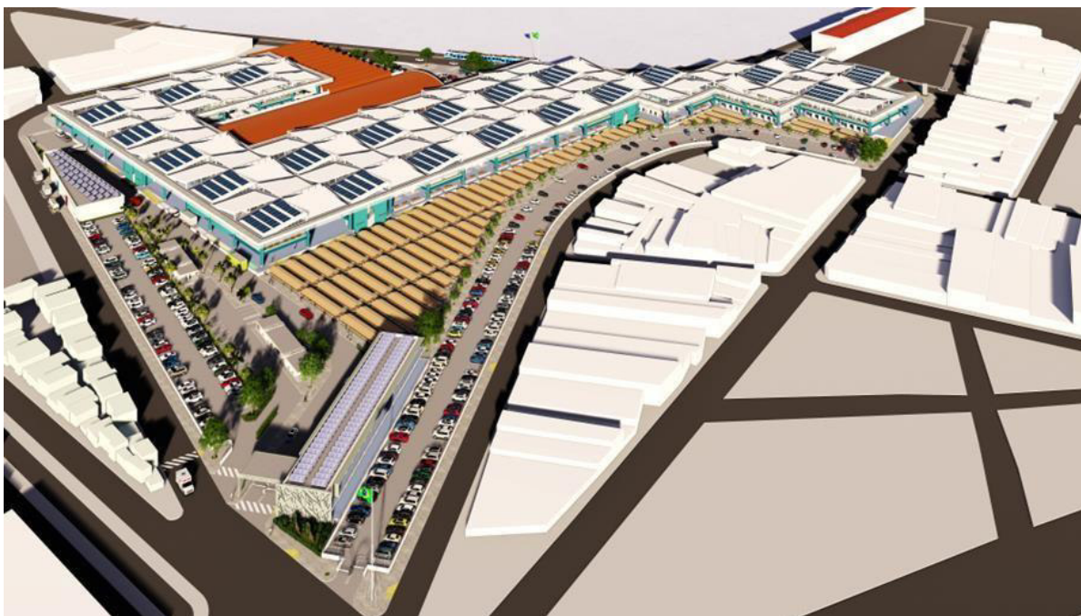
Figura 03 - Novo Mercado Público de Maceió