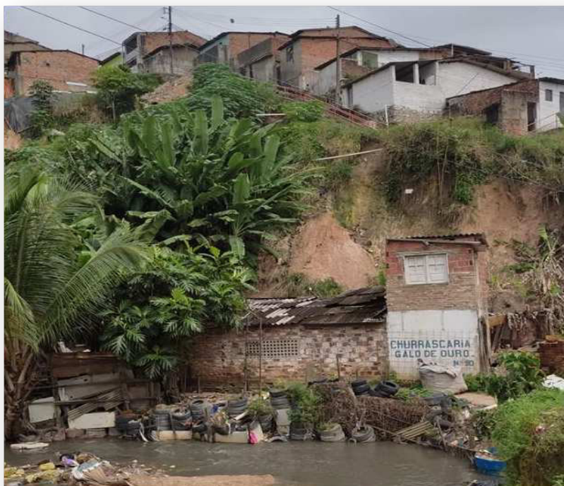
Figura 07 – Habitações em locais inadequados

Em síntese, a situação exposta põe em evidência a necessidade urgente de desenvolver projetos para obras de mitigação e prevenção dos pontos que apresentam altos níveis de vulnerabilidade ante os movimentos em massa. As áreas de riscos priorizadas para intervenção apresentadas neste documento estão baseadas nas 290 ocorrências registradas no mês de abril de 2021.