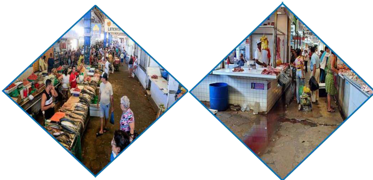
Figura 08 – Mercado Público da Produção

Para o cálculo do novo mercado foram trabalhados os dados existentes e estimativas de projeção.