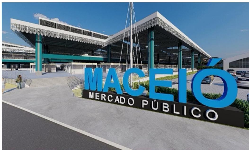
Figura 02 - Novo Mercado Público de Maceió

O projeto prevê a construção de um novo mercado da produção, localizado no mesmo espaço físico do antigo, a ser demolido. A nova estrutura aplicará o conceito de prédio sustentável verde, utilizando sistemas sustentáveis e de eficiência, assim como propõe sua valorização cultural, turística e gastronômica (Figura 02). Para a solução dos problemas elencados seguem as soluções projetadas: