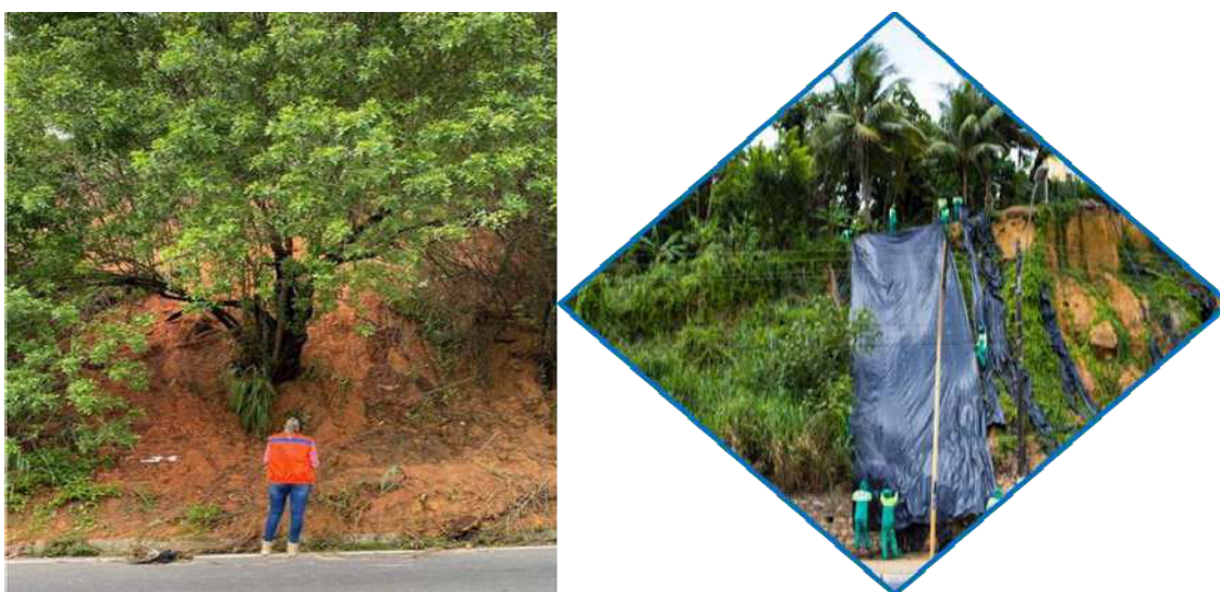
Figura 06 – Encostas afetadas pelas chuvas

Segundo o mapeamento de risco de Maceió do PMRR (Plano Municipal de Redução de Risco de Maceió), no qual há um detalhado e minucioso levantamento de campo de todos os assentamentos precários indicados pela Defesa Civil, existe um número significativo de moradias ameaçadas, indicadas para monitoramento e/ou remoção, em decorrência da gravidade observada em alguns assentamentos. Os resultados revelaram, ainda, novas situações de risco, que não estavam nos cadastros da Defesa Civil, em função da acelerada dinâmica de ocupação informal da cidade. Os setores de risco, que representam um espaço geográfico onde o fenômeno destrutivo poderá ocorrer, foram analisados e delimitados em mapa e feita a proposição de intervenções para a redução do risco (Figura 4).