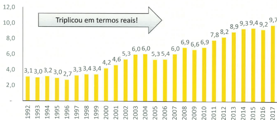
Brasil – Potencial de geração de Contribuição Previdenciária sobre faturamento, em valores constantes (Média 2017-IGP-DI)

Por outro lado, a contribuição do setor rural é o triplo, na expectativa da retomada da cobrança do Funrural, inversamente proporcional aos dados anteriormente apresentados, o que demonstra que, há mais recursos hoje, gerados pelo setor rural, ao invés de menos benefícios previdenciários a serem pagos ao mesmo setor. É a equação atual que justifica a implantação da isenção desta contribuição nas operações entre produtores rurais, operações estas que antecedem a entrega do produto primário à indústria.