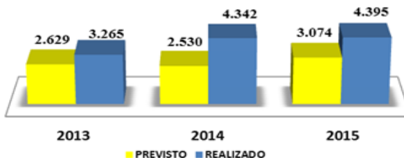
Gráfico 2 – Comparativo dos valores previstos e realizados em apoio aos tomadores de menor porte nos exercícios de 2013/2014 e 2015 (R$ mil)