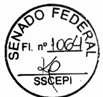
Anderson Máximo de Holanda - Procurador-Geral do Estado de Goiás -