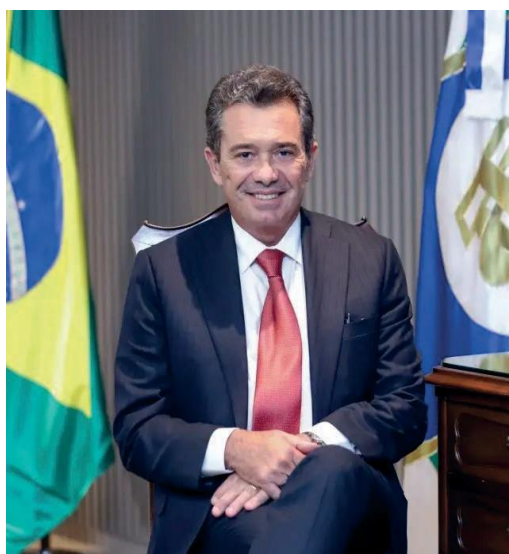
Ministro Vital do Rêgo Presidente do TCU