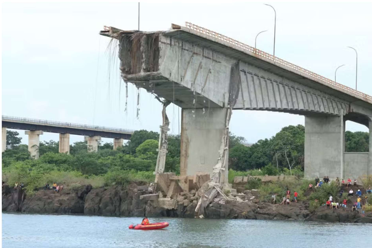
Imagem 2 - Ponto do Estreito, entre TO e MA desaba.