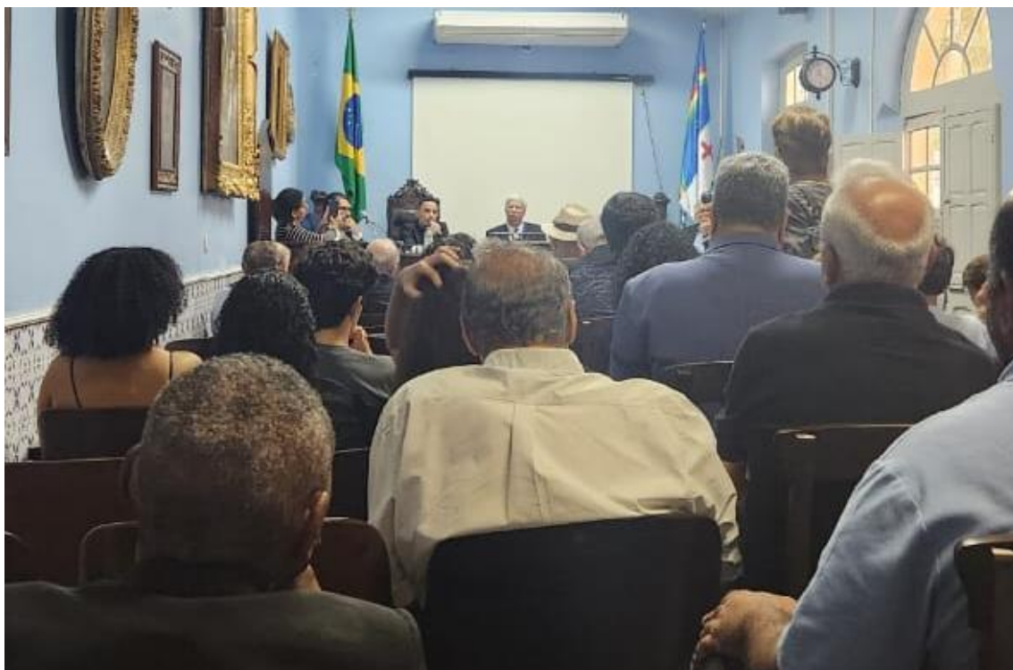
Recife (PE) - Presença no segundo dia de seminários do IAHGP