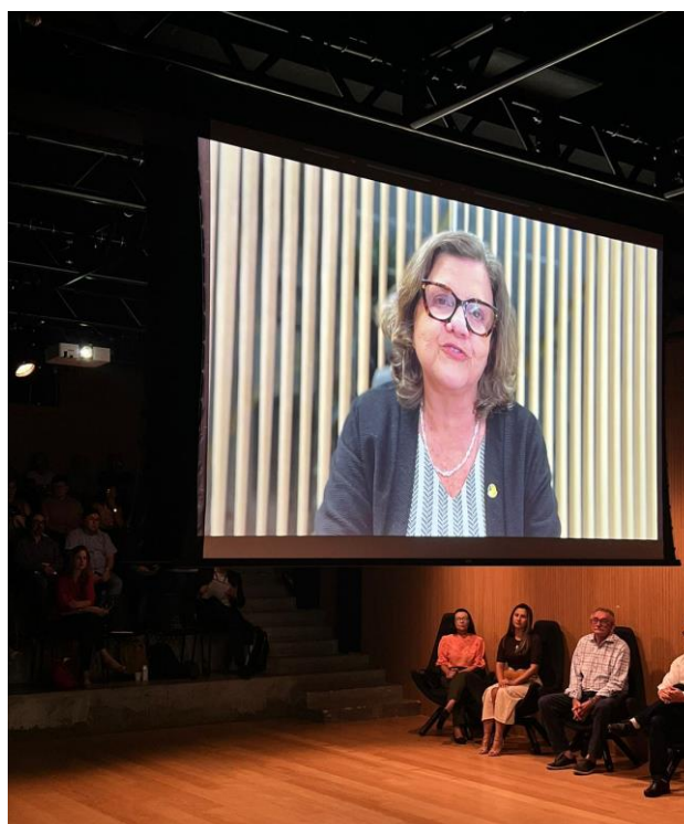
Crato(CE) - Apresentação dos trabalhos da CTI200CONFEQ durante audiência pública promovida pela Comissão de Esporte e Cultura da Assembleia Legislativa do Ceará