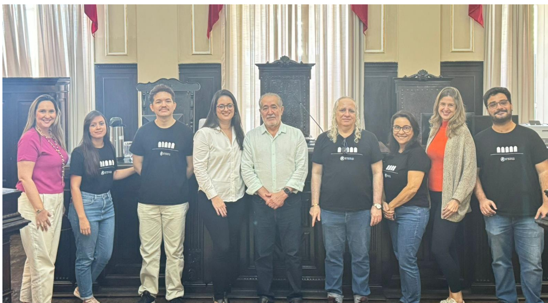
Recife (PE) - Visita guiada (Mediação) ao Palácio de Justiça, na Praça da República