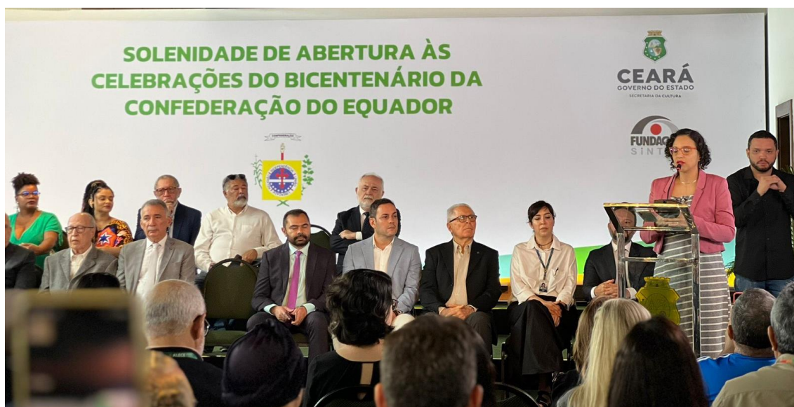
Fortaleza (CE) - Solenidade de abertura às celebrações do bicentenário da Confederação do Equador promovido pelo Governo do Estado, em parceria com a Sinfaf