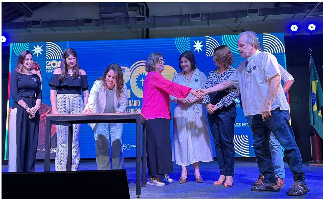
Olinda (PE) - Abertura das atividades de comemoração dos 200 anos da Confederação do Equador organizada pela vice-governadoria do Estado de Pernambuco