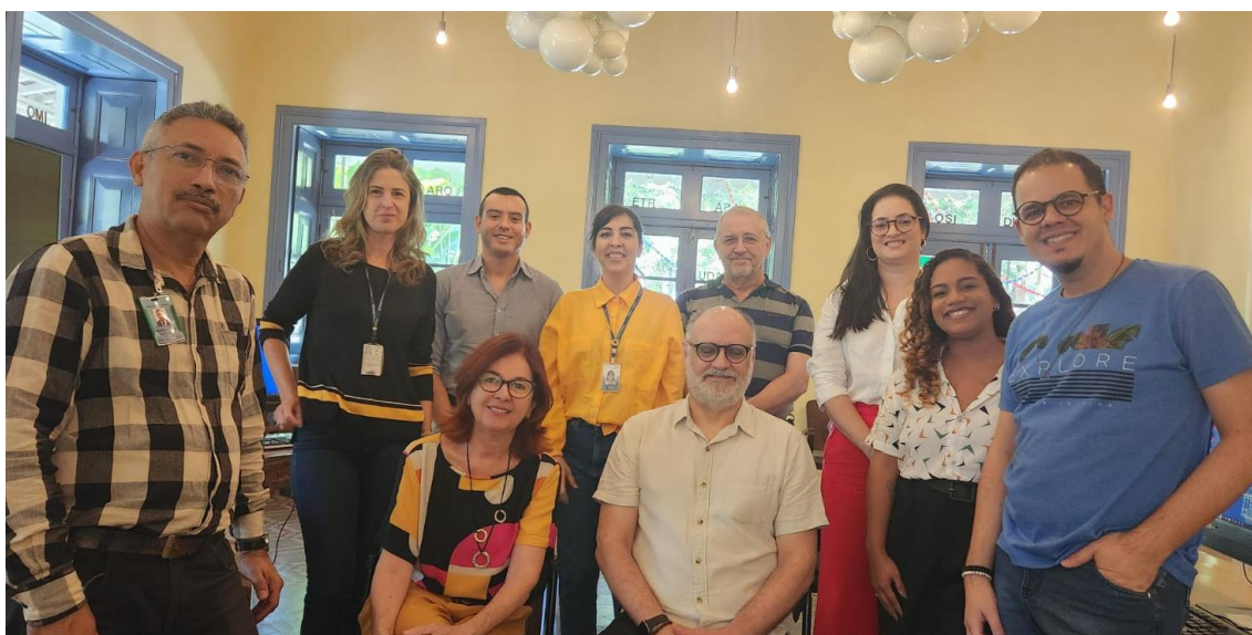
Recife (PE) - Recepção da equipe do Senado pelos servidores da Fundaj