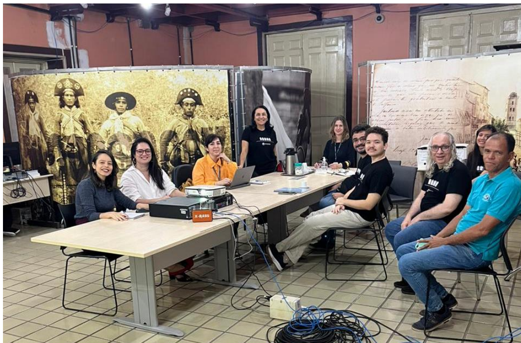
Recife (PE) - A equipe conhecendo, entre outras ações, a exposição virtual do Memorial do TJPE, a ser lançada em breve