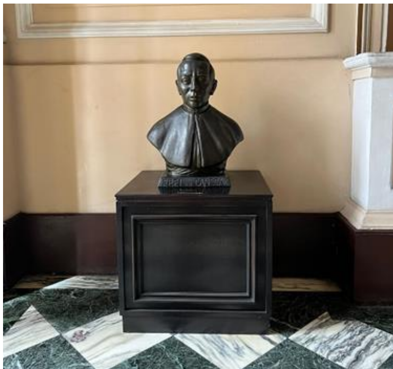
Recife (PE) - Busto de Frei Caneca no Tribunal de Justiça de Pernambuco