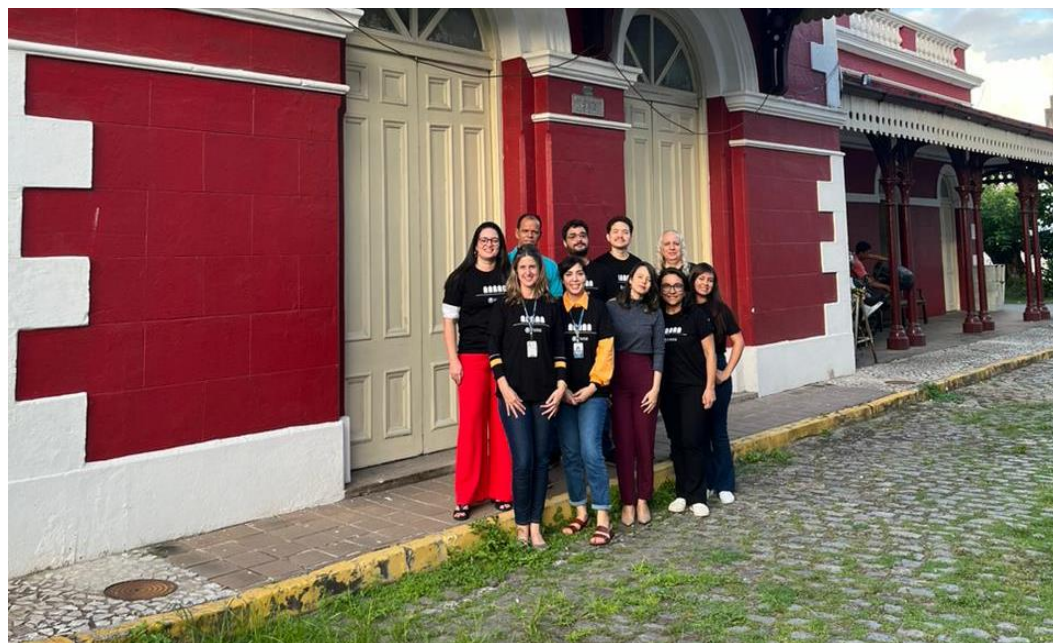
Recife (PE) - Equipes do memorial do TJPE e da CTI200CONFEQ dispostas a estreitar laços e atuar em parceria