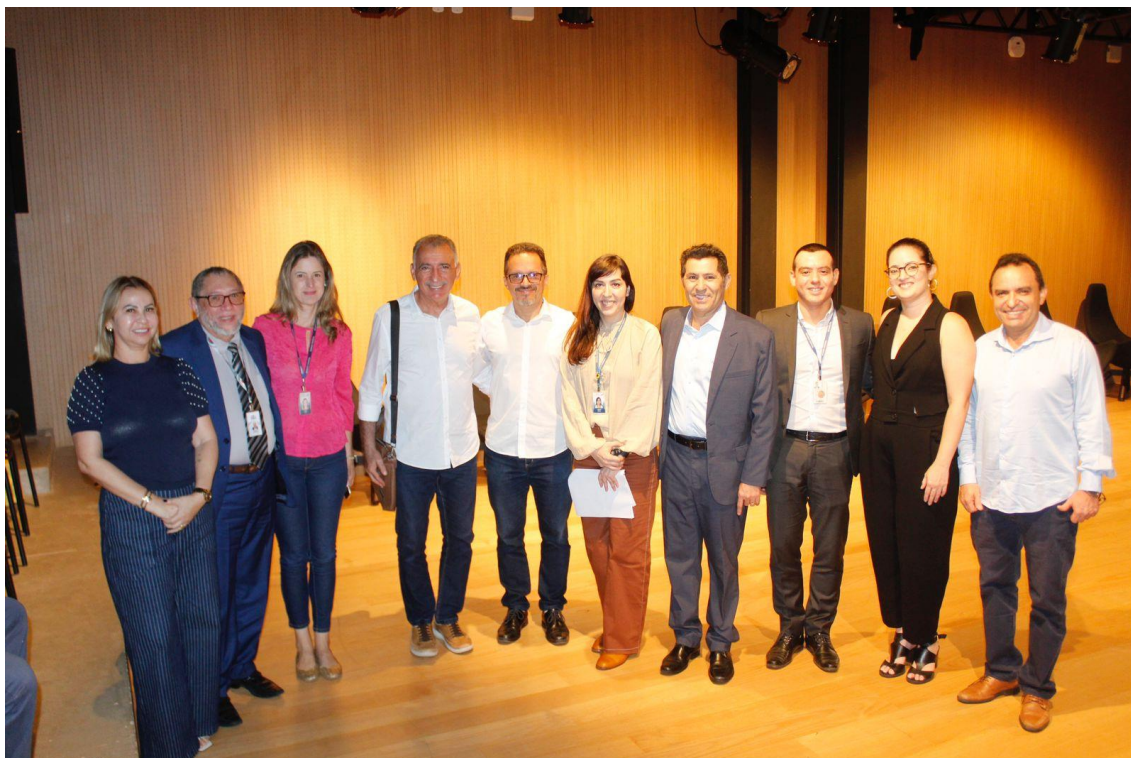
Crato(CE) - A equipe com participantes da audiência pública