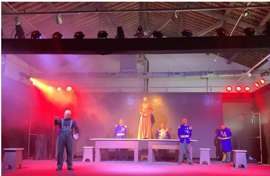
Olinda (PE) - Peça teatral "Frei Caneca – 200 anos da Confederação do Equador", com texto e direção de Carlos Carvalho