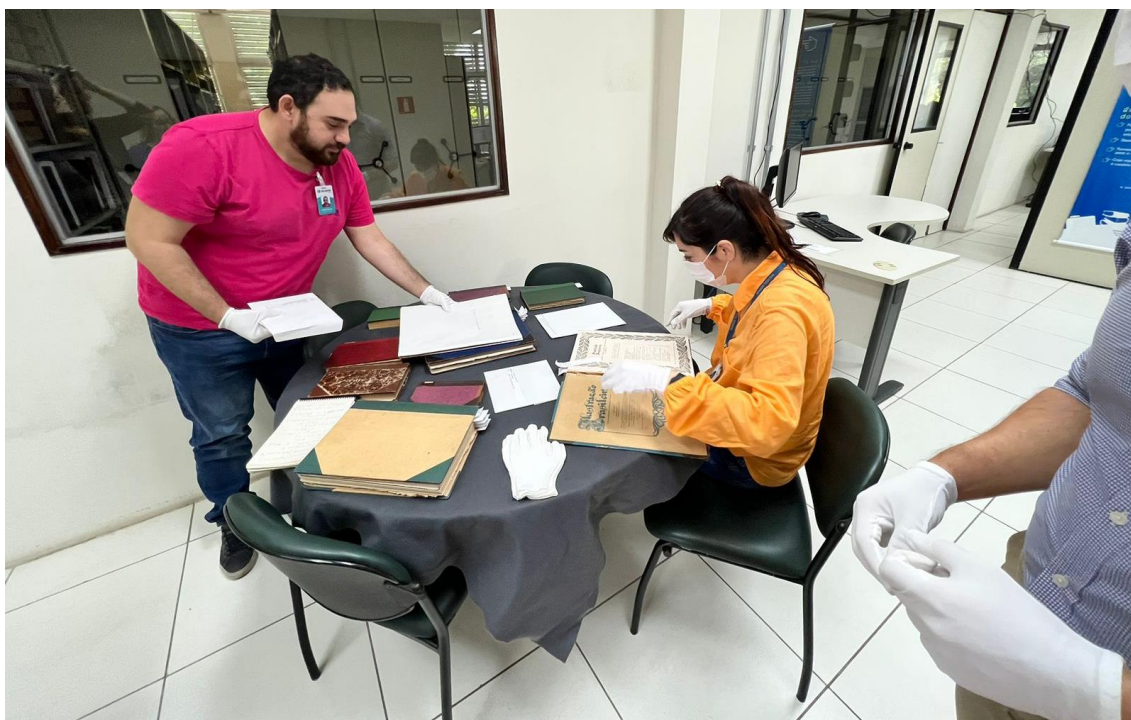
Recife (PE) - Manuseio de documentos raros na biblioteca da Fundaj