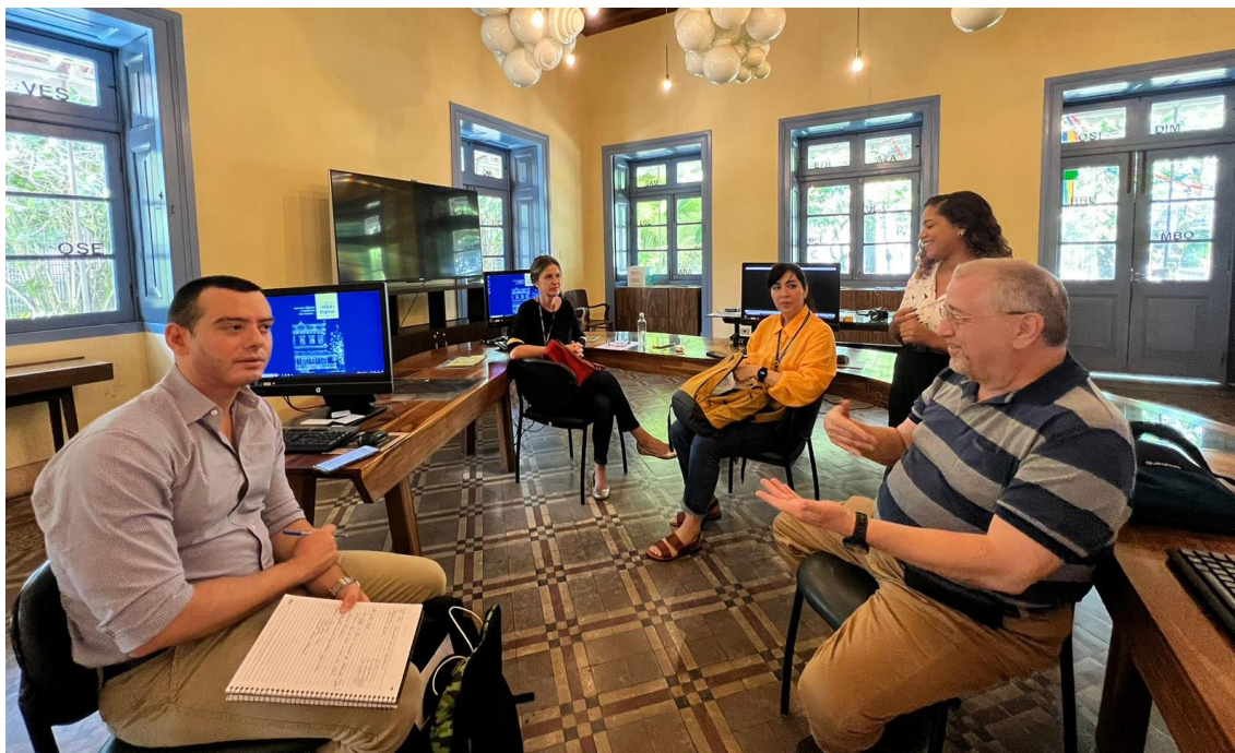
Recife (PE) - Reunião de trabalho antes do início da pesquisa iconográfica e documental