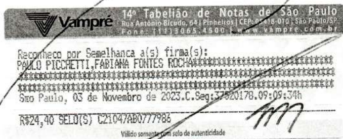
FABIANA FONTES ROCHA