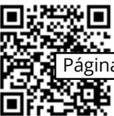
SENADOR MARCOS DO VAL Podemos/ES

Sendo assim, solicito a Vossa Excelência autorização para representar o Senado Federal em missão oficial no exterior, em viagem aos Estados Unidos da América, com ônus para o Senado Federal (diárias e passagens).