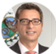
Dr. Carlos Portinho Senador da República do Brasil