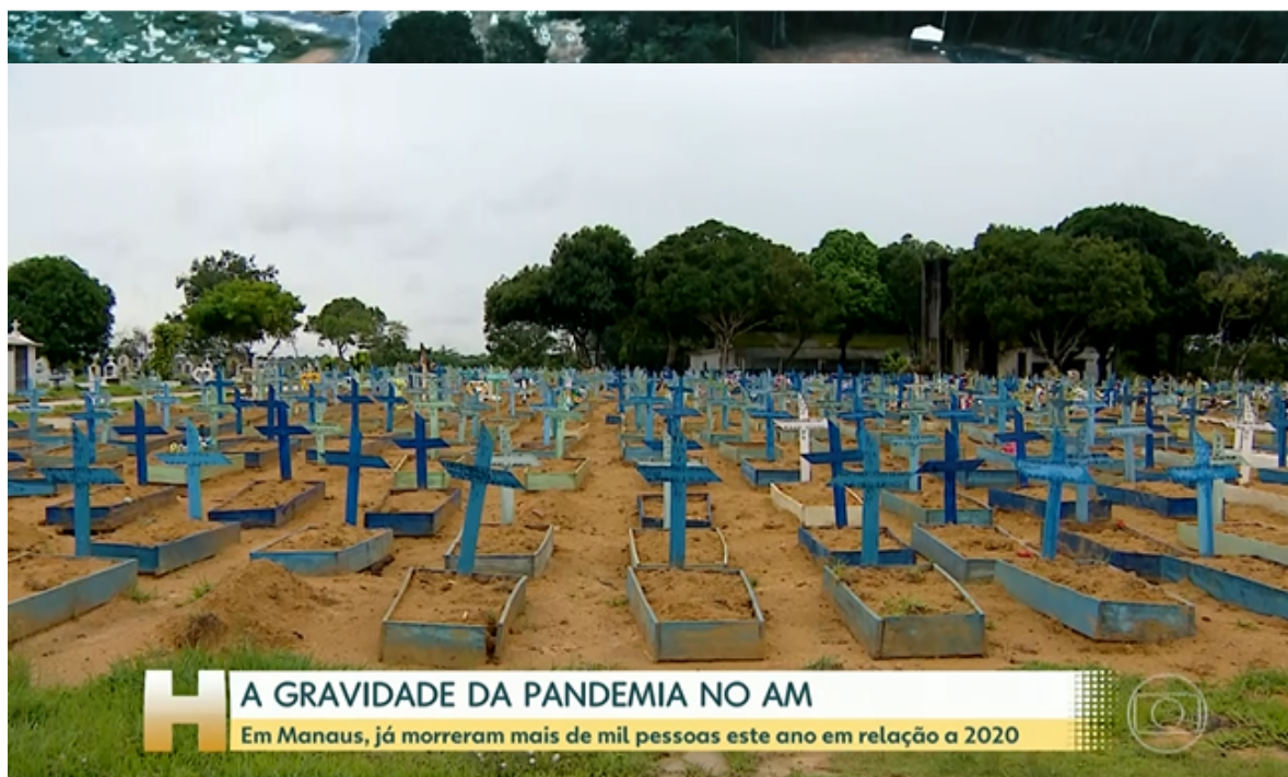
Cemitério Parque Tarumã – Visão geral.