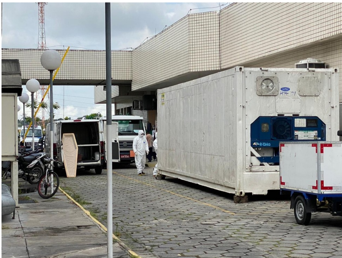
Câmara frigorífica foi instalada ao lado de necrotério do hospital João Lúcio, em Manaus

A quantidade de mortes diárias causou terror e espanto no Brasil e no mundo. Os hospitais já não suportavam a quantidade de mortes e os corpos eram encaminhados a câmaras frigoríficas (containers).