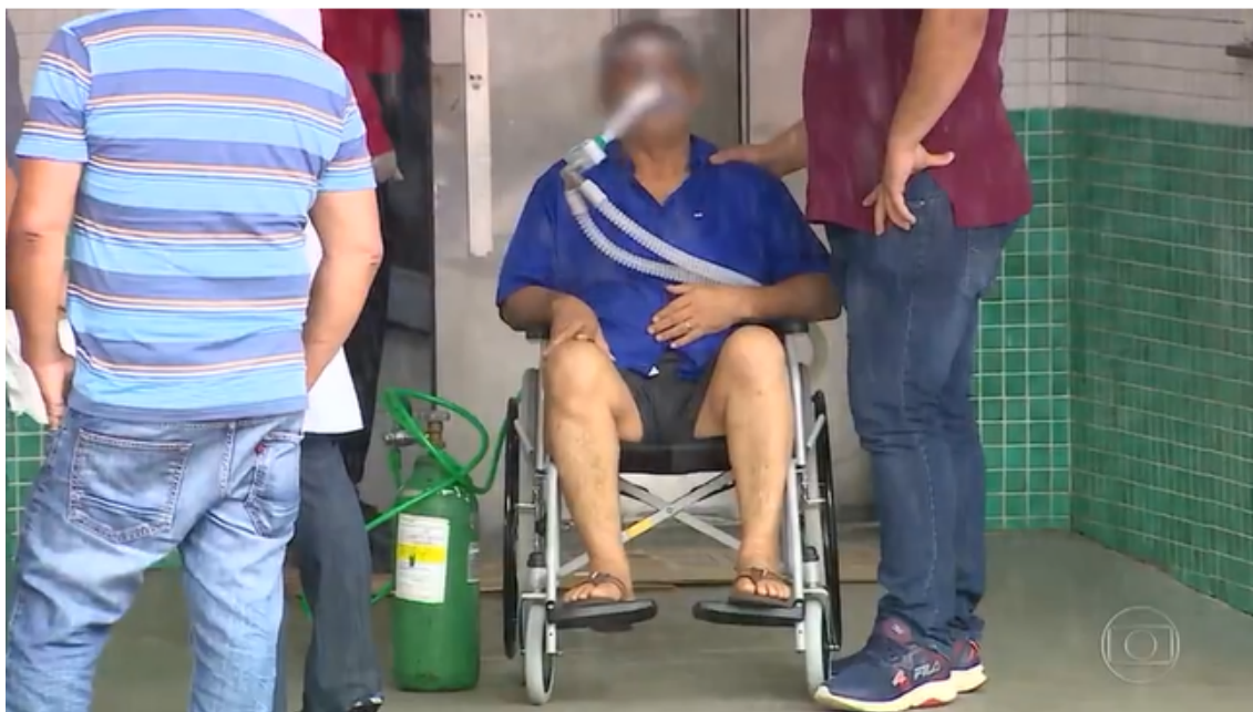
Em Manaus, hospitais lotados ficam sem oxigênio e pacientes são transferidos para outros estados