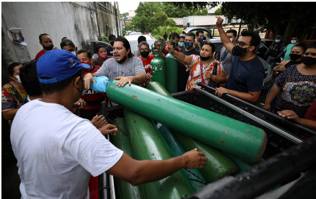
Parentes de pacientes hospitalizados se reúnem para comprar oxigênio e encher botijões em empresa privada em Manaus — Foto: REUTERS/Bruno Kelly – FONTE: https://g1.globo.com/am/amazonas/noticia/2021/02/14/crise-do-oxigenio-um-mes-apos-colapso-em-hospitais-manaus-ainda-depender-de-doacoes-do-insumo.ghtml