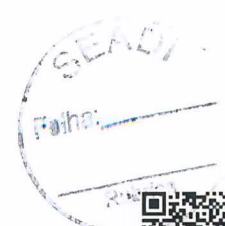
Senador Flávio Arns (REDE - PR)