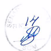
SENADOR MARCOS DO VAL Vice-Presidente da Comissão Relações Exteriores e Defesa Nacional