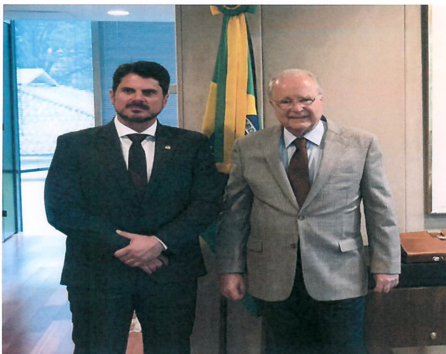
Foto 05: Ao lado do Embaixador do Brasil, Sergio Silva do Amaral.