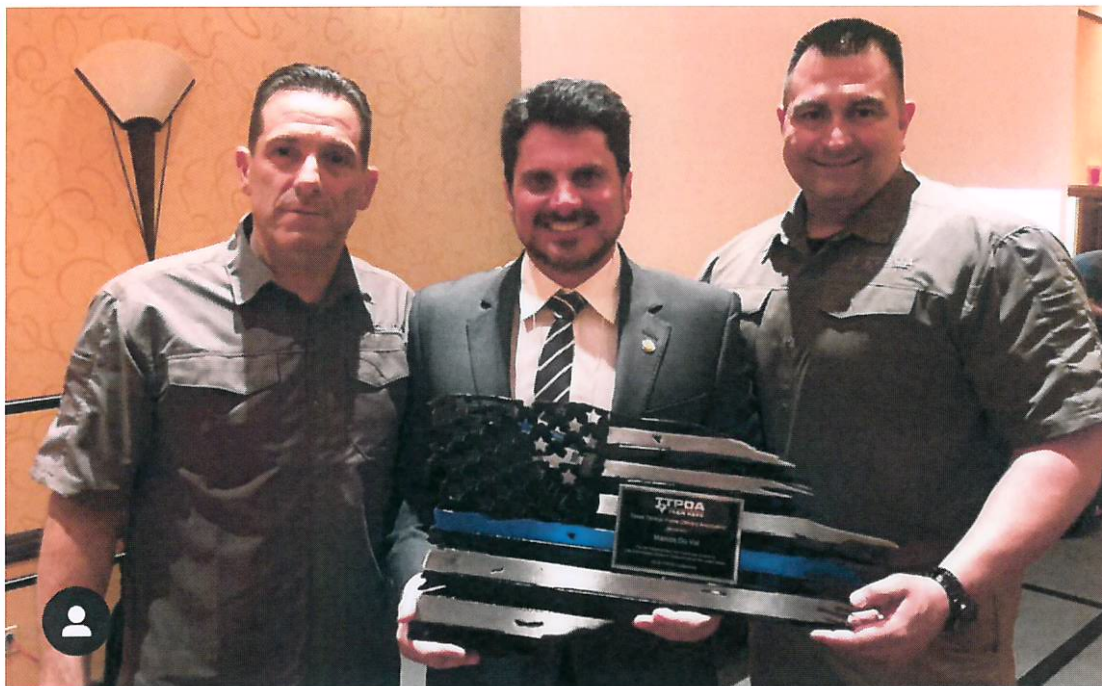
Foto 01: À esquerda, o Diretor da TTPOA e à direita, o Presidente da TTPOA.

BREVE RESUMO DO EVENTO: como forma de reconhecimento aos meus 20 anos de carreira como instrutor policial e a minha eleição para o cargo de Senador da República, fui homenageado pela Texas Tactical Police Officers Association , em Conferência realizada em San Marcos, no Texas. Vale registrar que esse evento ocorre anualmente e visa fomentar a troca de ideias e de informações sobre operações policiais táticas, equipamentos e armas e conta com a participação dos melhores instrutores e policiais americanos. A seguir, colaciono alguns registros desse evento: