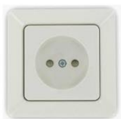
electricity - type C (socket)...