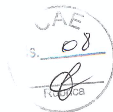
Senador Tasso Jereissati Presidente da Comissão de Assuntos Econômicos