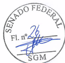
Senador Cássio Cunha Lima Primeiro Vice-Presidente do Senado Federal, no exercício da Presidência