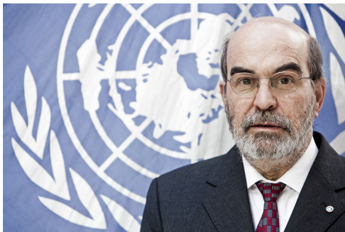
José Graziano da Silva Diretor-Geral da FAO

Brasileiro, agrônomo e professor 1 , José Graziano da Silva trabalha com agricultura, desenvolvimento rural e segurança alimentar desde 1972. Entre 2003 e 2004, foi Ministro Extraordinário de Segurança Alimentar e Combate à Fome, sendo o responsável pela implementação do Programa Fome Zero. Em 26 de junho de 2011, foi eleito Diretor-Geral da FAO, tornando-se o primeiro latino-americano a ocupar tal posição. Em junho de 2015, foi reeleito, como candidato único, com 177 votos favoráveis dos 182 possíveis. Seu segundo mandato de quatro anos estende-se até 31 de julho de 2019.