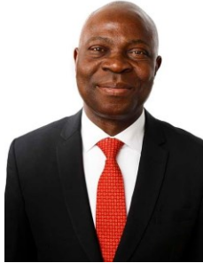
Gilbert Fossoun Hounbo Presidente do FIDA

Nascido em Agbandi, no Togo, em 1961, graduou-se em Contabilidade e Finanças pela Universidade do Québec (Canadá). É Mestre em Gestão de Empresas pela Universidade de Lomé, Togo, e possui um diploma de Estudos Superiores Especializados em Contabilidade, também pela Universidade do Québec.