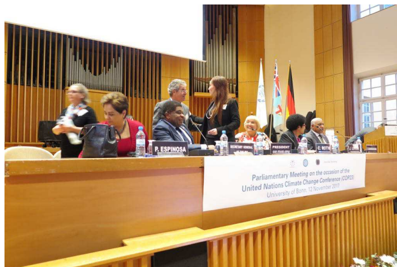
Foto 5 – Senador Jorge Viana e a Presidente da União Interparlamentar (UIP).