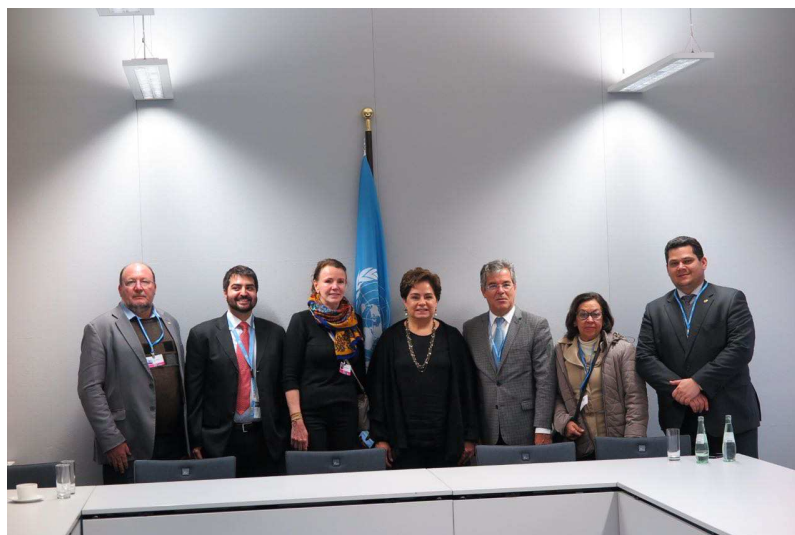
Foto 12 – Reunião dos parlamentares brasileiros com Patricia Espinosa, Secretária da UNFCCC.