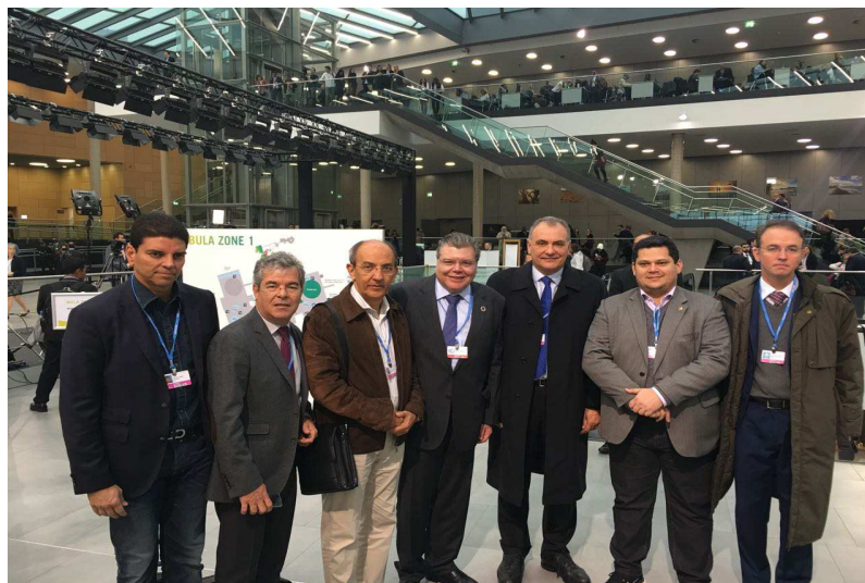
Foto 13 – Encontro com Ministro do Meio Ambiente, José Sarney Filho.