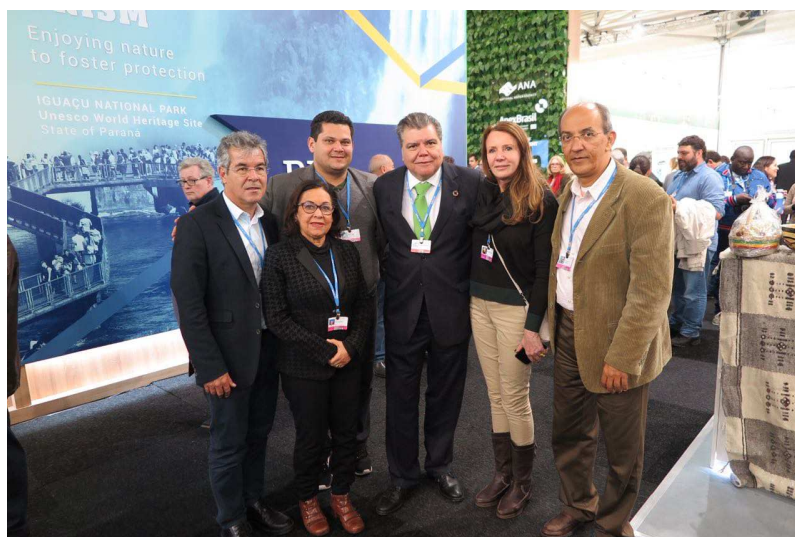
Foto 8 – Encontro entre parlamentares brasileiros e Ministro do Meio Ambiente, Sarney Filho.