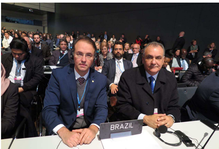
Foto 16 – Deputados Leo de Britto e Nelson Pelegrino na Plenária de Alto Nível.

Anexo II, Ala Teotônio Vilela, Gabinete 15, CEP 70.165-900, Brasília/DF Telefone: 3303-6408 Fax 6414 lidice.mata@senadora.gov.br / secgabsenlidice@senado.gov.br