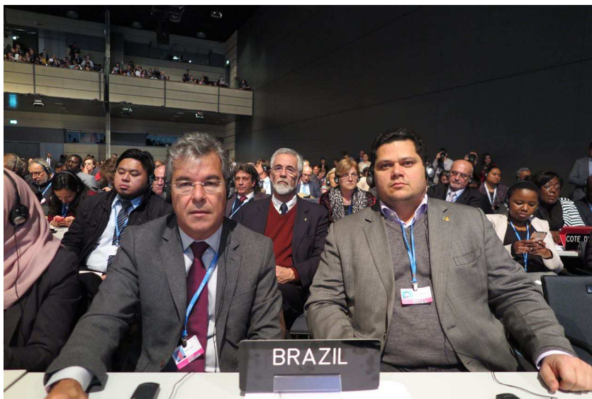
Foto 15 – Senadores Jorge Viana e Davi Alcolumbre participando da Plenária de Alto Nível.