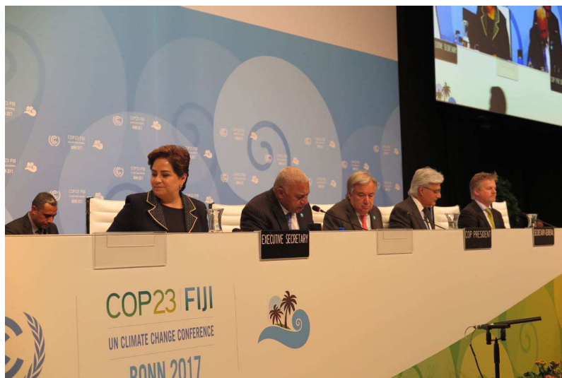
Foto 14 – Abertura da Plenária de Alto Nível da COP-23 com chefes de Estado.