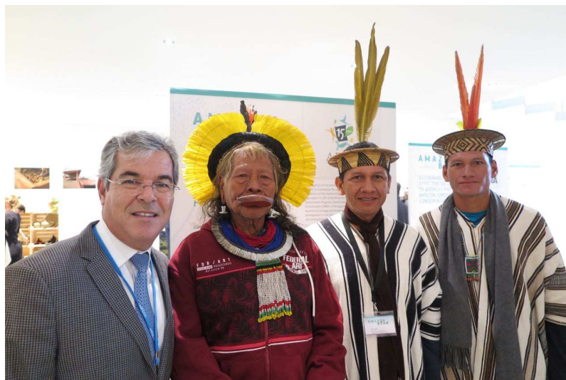
Foto 11 – Senador Jorge Viana, Cacique Raoni e líderes Ashaninka.