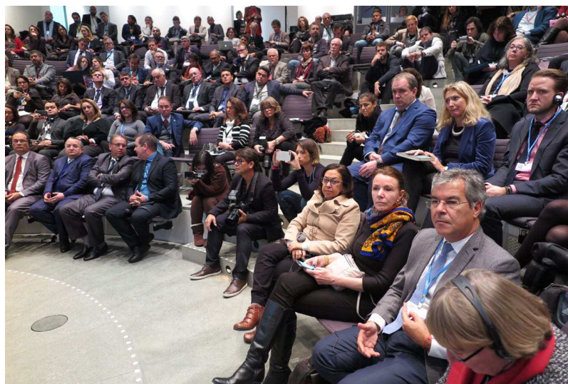
Foto 10 – Participação dos parlamentares no Dia da Amazônia ( Amazon Bonn day ).