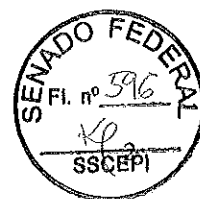
Senadora Kátia Abreu PSD/TO