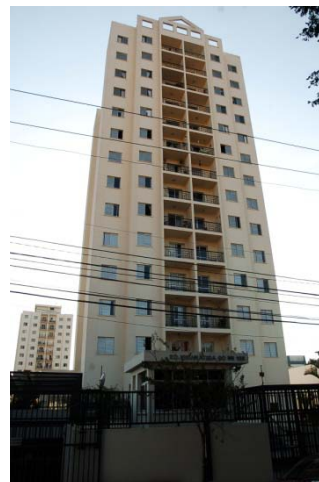
Jd. da Saúde