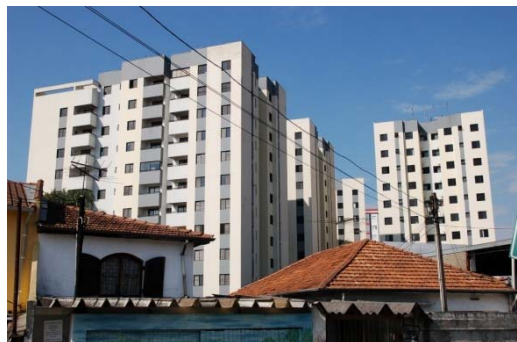
Portal do Jabaquara