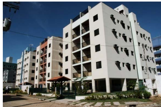
Praias de Ubatuba