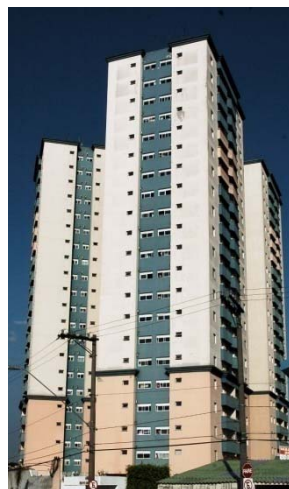
Recanto das Orquídeas