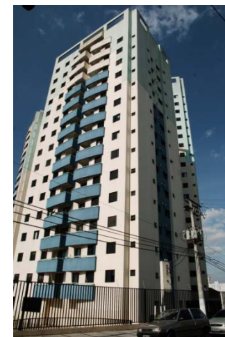
Solar de Santana