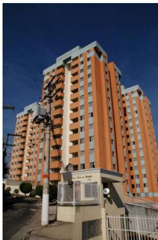
Torres de Pirituba