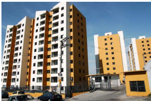
Moradas da Flora