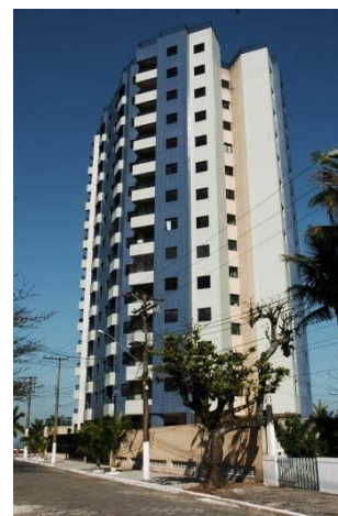
Pq. das Flores