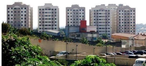
Veredas do Carmo