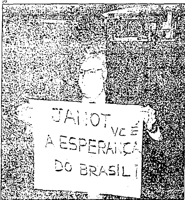
Janot com cartaz recebido e enviado instantes na última segunda. "Quem tiver de pagar vai pagar"

A mensagem foi dirigida a todos os integrantes da instituição. Pela leitura de procuradores, a carta é uma forma de buscar apoio interno diante de fortes pressões a que Janot vem sendo submetido desde que precisou escolher quem está dentro e quem está fora do escândalo com potencial para se igualar aos processos do mensalão no STF. Há um receio interno de que investidas no Congresso contra a instituição se intensifiquem, com a apreensão de limites de atuação dos integrantes do Ministério Público, principalmente com a fração dos dois homens mais poderosos do Congresso, os presidentes da Câmara dos Deputados, Eduardo Cunha (PMDB-RJ), e do Senado, Renan Calheiros (PMDB-AL). Os dois são alvo de pedido de abertura de inquérito no Supremo. Embora a informação sobre os 28 inquéritos atada esteja sob sigilo, Cunha e Renan passaram o dia ontem dando explicações sobre o suposto envolvimento nas denúncias de corrupção na Petrobras.