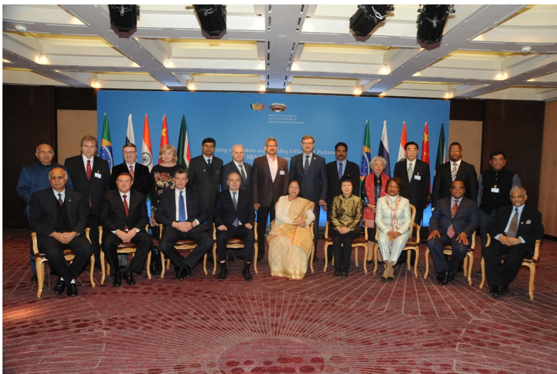
Figura - BRICS