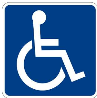
Figura 1 - Símbolo Internacional de Acesso - SIA

Descrição: A representação do SIA consiste em pictograma branco representando um ser humano estilizado em cadeira de rodas, voltado para a direita, sobre fundo azul (referência Munsell 10B5/10 ou Pantone 2925 C). Este símbolo pode, opcionalmente, ser representado em branco e preto (pictograma branco sobre fundo preto ou pictograma preto sobre fundo branco). Nenhuma modificação, estilização ou adição deve ser feita a este símbolo.