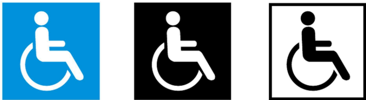
a) Branco sobre fundo azul b) Branco sobre fundo preto c) Preto sobre fundo branco

4.5. Abaixo, temos o símbolo normatizado pela ABNT NBR 9050 e referenciado inicialmente na ISO7001