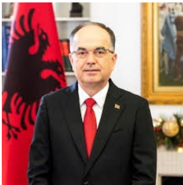
PRESIDENTE BAJRAM BEGAJ

Bajram Begaj nasceu em 20 de março de 1967, em Rrogozhinë, cidade que integra a Prefeitura de Tirana. Militar reformado do exército albanês com patente de General, é oficial médico. Tendo concluído sua formação nos Estados Unidos, foi Chefe do Estado-Maior Geral das Forças Armadas de julho de 2020 a junho de 2022. Em 3 de junho de 2021, foi oficialmente indicado pelo majoritário Partido Socialista (PS) como candidato às eleições presidenciais de 2022 – o Presidente da Albânia é eleito indiretamente, pelo Parlamento, para mandato de 5 anos. Considerado politicamente independente, propôs-se, no discurso de posse, a contribuir para o diálogo e cooperação entre as forças políticas do país, a favorecer a união nacional e o debate democrático. Afirmou a importância da evolução do processo de acesso do país à União Europeia, a partir da abertura de negociações formais, e prometeu apoiar a consolidação das instituições, "que têm a responsabilidade de proteger e promover os interesses dos albaneses, onde quer que estejam". O mandato de Begaj tem sido marcado pelo compromisso de melhorar as relações internacionais da Albânia e promover a integração euro-atlântica. Assim, desde que assumiu o cargo, envolve-se ativamente em esforços diplomáticos, realizando visitas internacionais para promover parcerias e elevar a posição global da Albânia, e recebendo dignitários estrangeiros. Begaj é casado com Armanda Begaj, com quem tem dois filhos, Dorian e Klajdi.