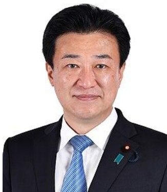
MINORU KIHARA MINISTRO-CHEFE DO GABINETE DO JAPÃO

consecutivas para essa cadeira. Leal ao ex-PM Shinzo Abe, foi Ministro da Economia, Comércio e Indústria (2012-2014), Ministro da Revitalização Econômica durante a negociação do TPP (2017-2019), e Ministro dos Negócios Estrangeiros (2019-2021). Foi Secretário-Geral do Partido Liberal Democrático (PLD) entre 2021 e 2024.