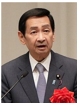
MASAKAZU SEKIGUCHI PRESIDENTE DA CÂMARA DOS CONSELHEIROS

Nascido em 12 de agosto de 1969 em Kumamoto, formou-se pela Faculdade de Educação da Universidade de Waseda em 1993. Atuou como Conselheiro Especial do Primeiro-Ministro para Assuntos de Segurança Nacional entre 2019 e 2021 e Ministro da Defesa de 2023 a 2024. Já ocupou também o cargo de Vice-Ministro Parlamentar da Defesa. Membro do Partido Liberal Democrata, exerce mandato na Câmara dos Representantes. Foi nomeado Ministro-Chefe do Gabinete em 21 de outubro de 2025.