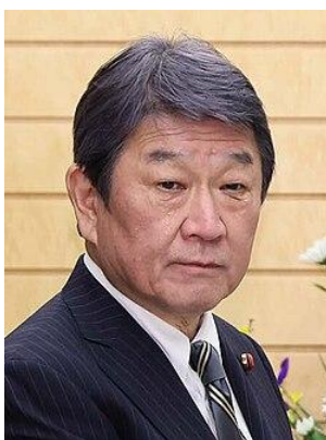
TOSHIMITSU MOTEGI MINISTRO DOS NEGÓCIOS ESTRANGEIROS

Nascida em 1961, é a primeira mulher a ocupar o cargo de chefe de governo no Japão. Takaichi foi deputada durante dez mandatos não consecutivos pela Província de Nara. Ocupou cargos de Ministra de Ciência e Tecnologia (2006–2008), Ministra de Assuntos Internos e Comunicações (2014-2017 e 2019-2021) e Ministra da Segurança Econômica (2022-2024). Discípula do ex-PM Shinzo Abe, integra a ala conservadora do Partido Liberal Democrático (PLD) e, durante a campanha, priorizou agenda de segurança — defesa nacional, segurança energética (inclusive o uso de energia nuclear) e alimentar. Tomou posse em 21/10/2025.