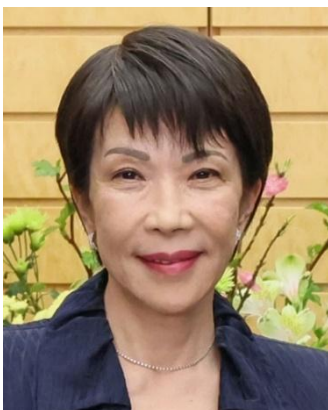
SANAE TAKAICHI PRIMEIRA-MINISTRA

casamento de Naruhito em 1992. Casou-se em 1993 e, em 2001, nasceu a princesa Aiko.