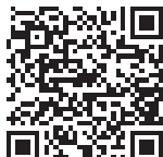
TABELA IV: Ministério da Educação Ações da Educação Básica

A Tabela IV detalha as principais ações orçamentárias das subfunções vinculadas à educação básica (306 – Alimentação e Nutrição, 362 – Ensino Médio, 365 – Educação Infantil, 366 – Educação de Jovens e Adultos, 367 – Educação Especial, 368 – Educação Básica e 847 – Transferências para a Educação Básica). No conjunto, o valor das ações para 2026 cresceu R$ 19.4 bilhões (+24,1%) em comparação com o PLOA 2025. Na proposta atual, a ação “00SB - Complementação da União ao Fundeb” responde por 70,0% das dotações relativas às subfunções vinculadas à educação básica.