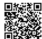
COMANDANTE DAN – PODEMOS/AM Deputado Estadual

Assinatura manuscrita em azul, com o nome 'Dan' visível no final da linha.