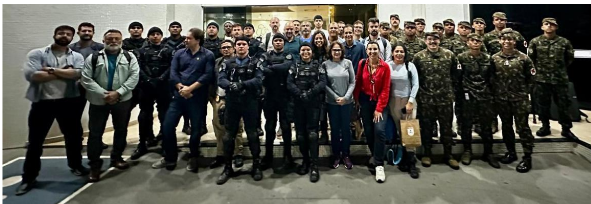
Foto oficial da comitiva

A comitiva realizou a seguinte agenda de compromissos nos dias 29 a 31 de maio em Roraima: