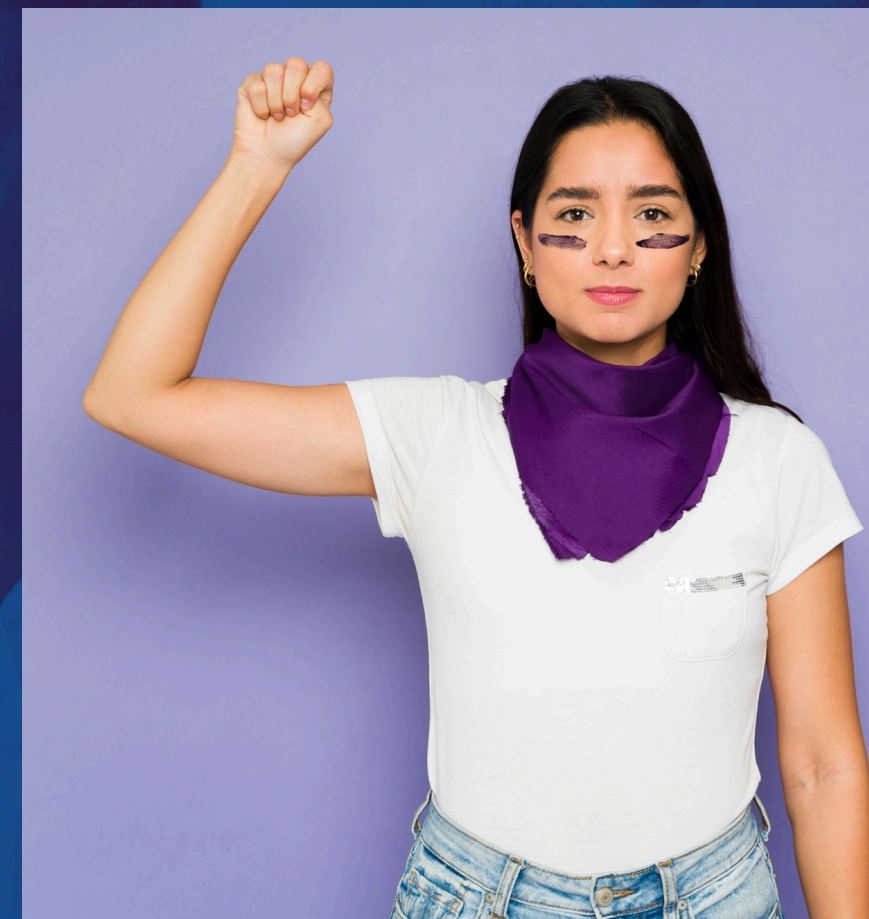
Patrulha Maria da Penha