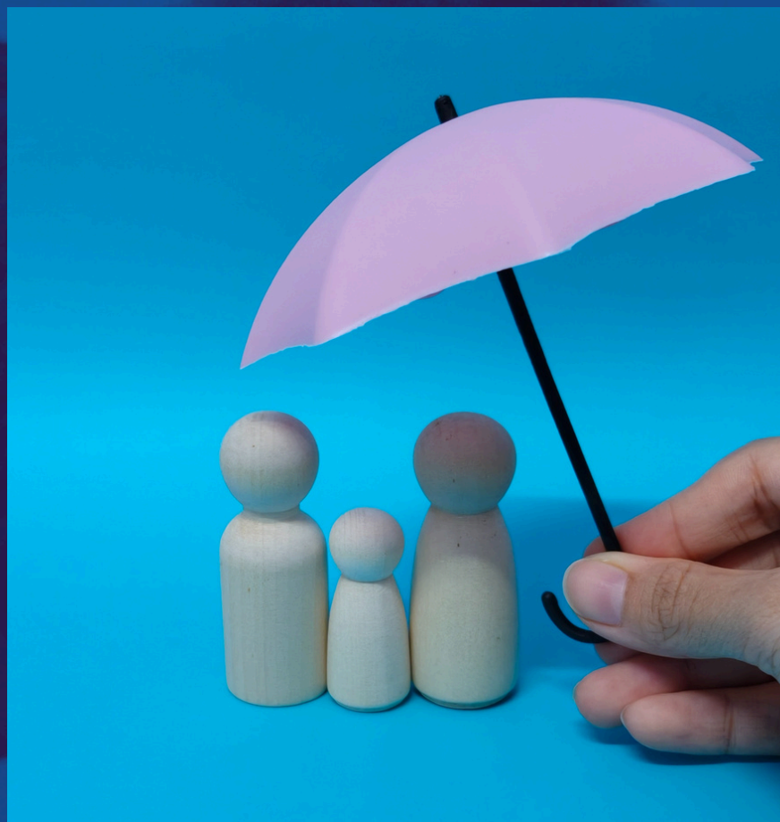
Casa da Mulher Brasileira