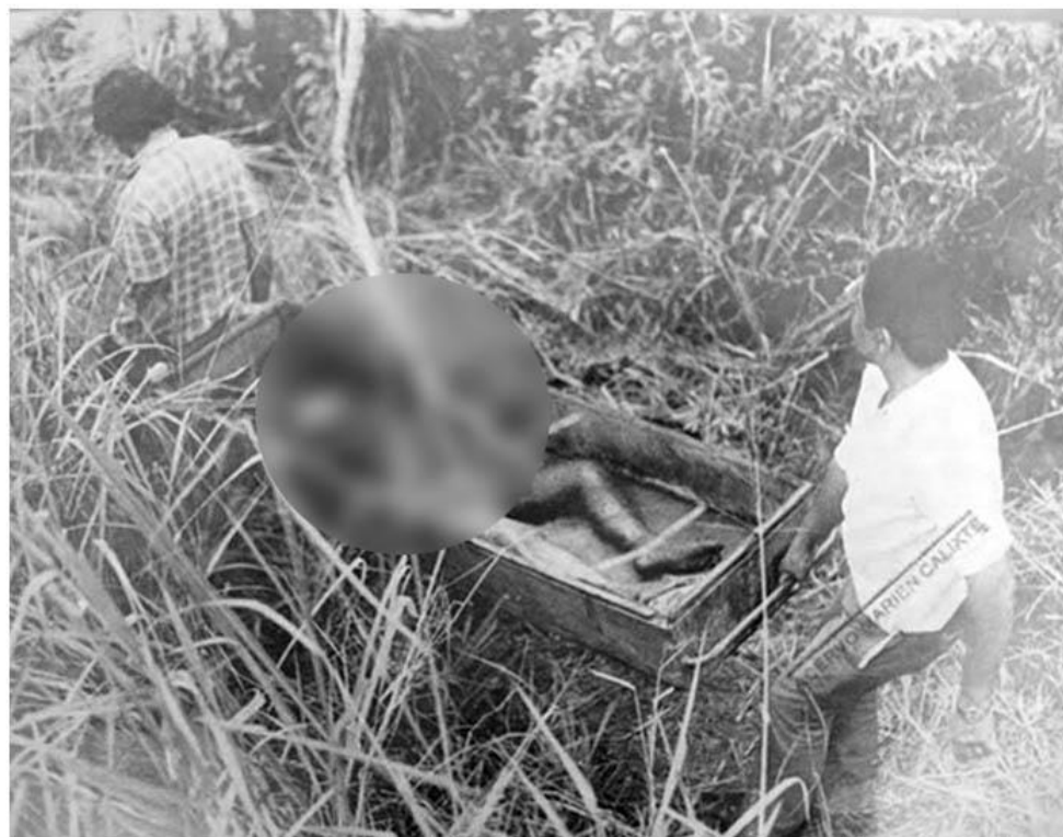
Resgate do corpo da menina.