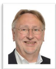
Bernd LANGE - Presidente INTA (S&D) – Nacionalidade: Alemanha