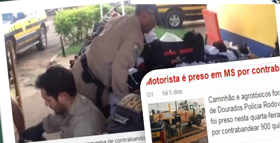
Domingo Espetacular mostra esquema de contrabando