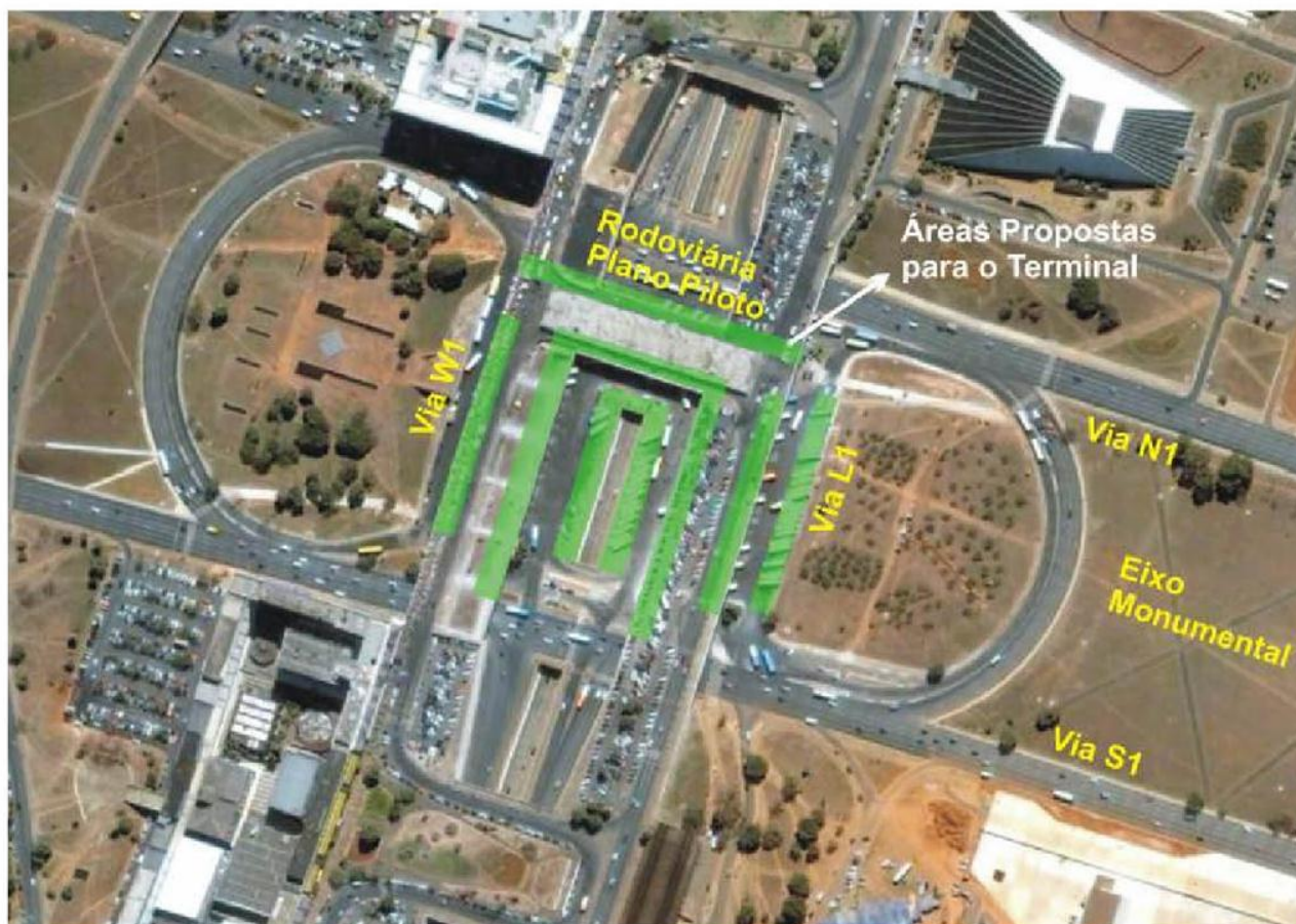
Anexos da Rodoviária do Plano Piloto