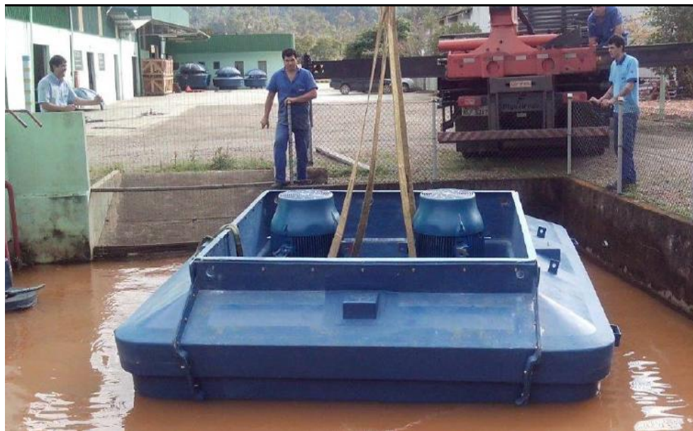
Bombeador em teste

Valor do Investimento: R$ 1.726.342,64 (um milhão, setecentos e vinte e seis mil, trezentos e quarenta e dois reais e sessenta e quatro centavos).