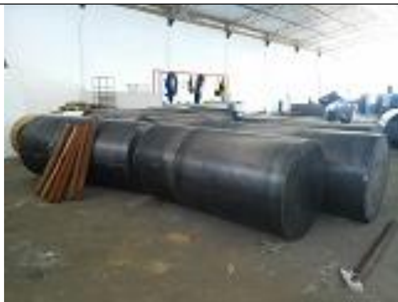
Fabricação dos flutuadores - OPEMACS