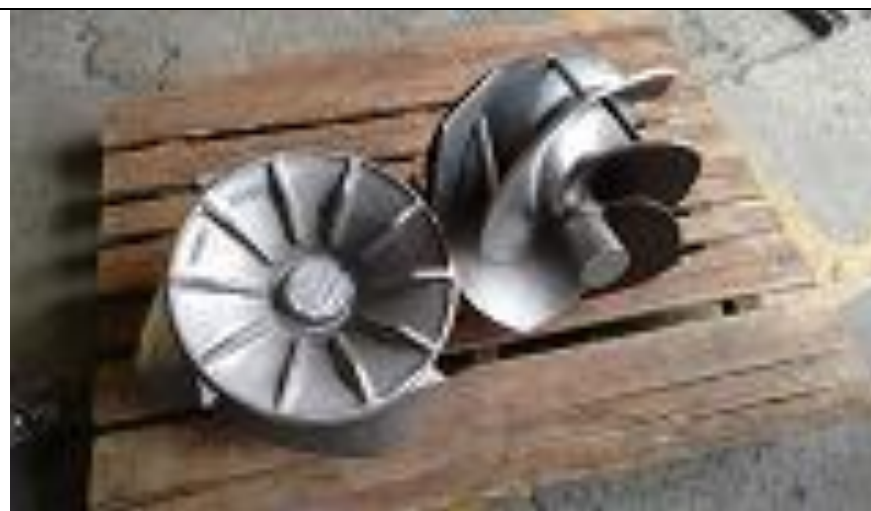
Rotores na fundição da contratada - KSB