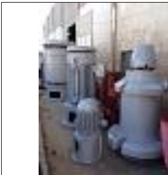
Bombedor em fabricação - OPEMACS

Valor do Investimento: R$ 1.030.340,98 (um milhão, trinta mil, trezentos e quarenta reais e noventa e oito centavos).