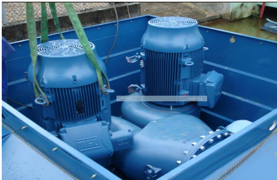
Bombeador em fabricação

Valor do Investimento: R$ 880.547,98 (oitocentos e oitenta mil, quinhentos e quarenta sete reais e noventa e oito centavos).