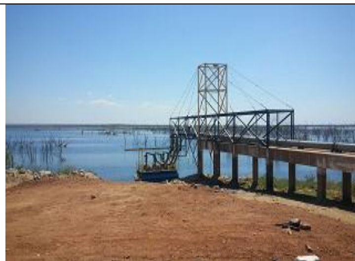
Flutuante em operação