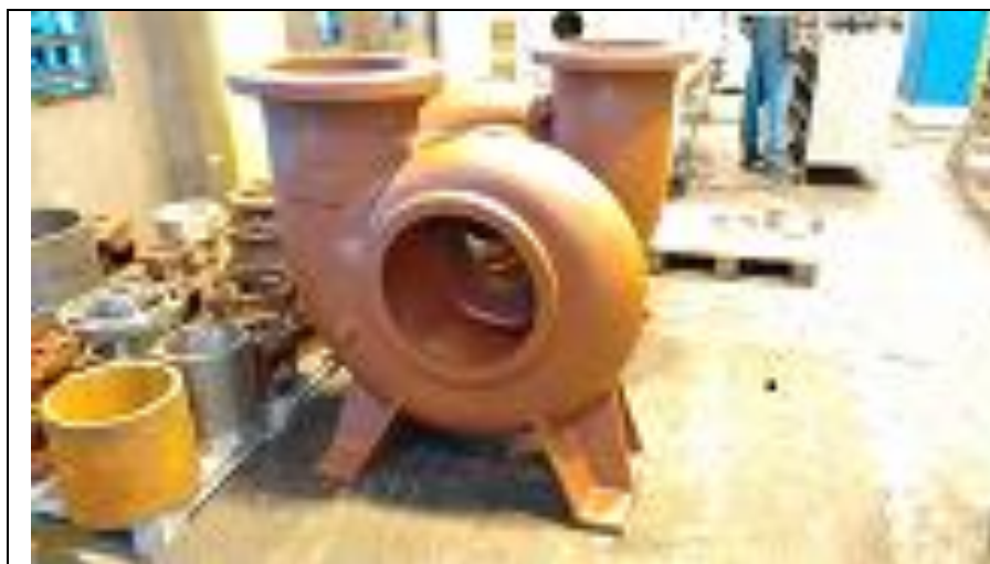
Bombeador em fabricação - KSB

Valor do Investimento: R$ 1.704.618,99 (um milhão, setecentos e quatro mil, seiscentos e dezoito reais e noventa e nove centavos).