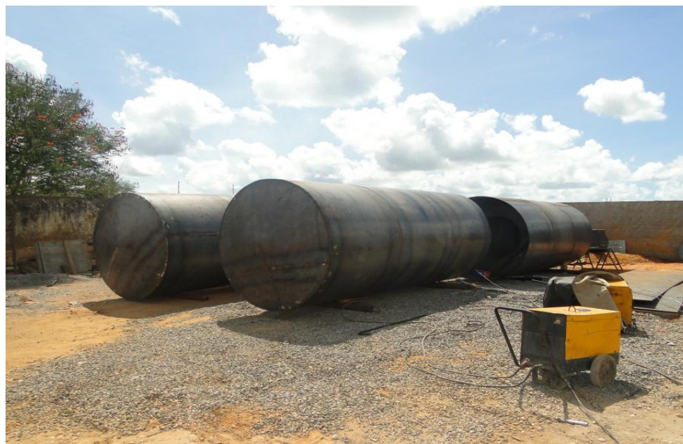
Flutuadores na Fábrica

Valor do Investimento: R$ R$ 1.095.000,00 (um milhão e noventa e cinco mil reais).