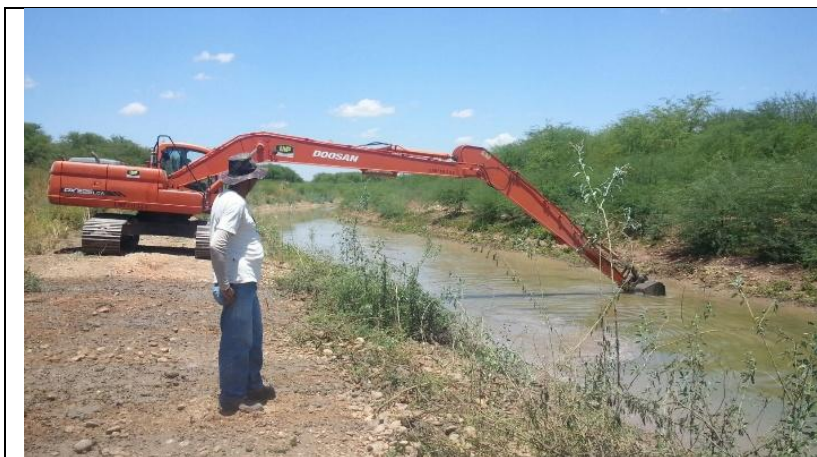
Desassoreamento do canal de aproximação - ÉTICA

Valor do Investimento: R$ 583.557,95 (quinhentos e oitenta e três mil, quinhentos e cinquenta e sete reais e noventa e cinco).