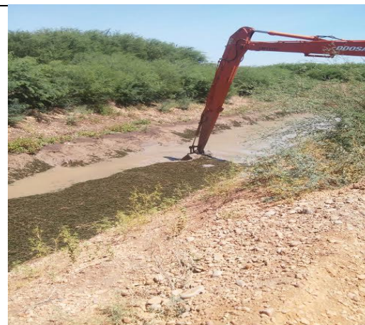
Profundidade do desassoreamento 2,20m