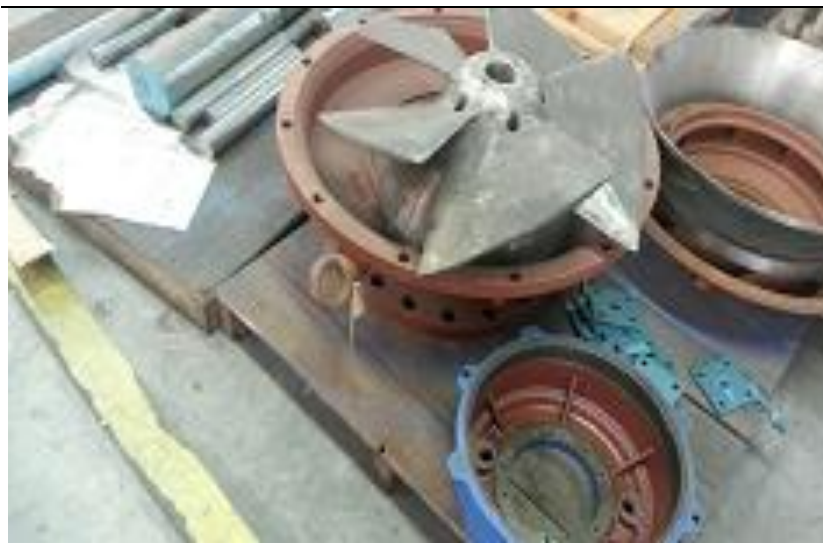
Bombedor em fabricação

Valor do Investimento: R$ 1.257.837,03 (um milhão, duzentos e cinquenta e sete mil, oitocentos e trinta e sete reais e três centavos).