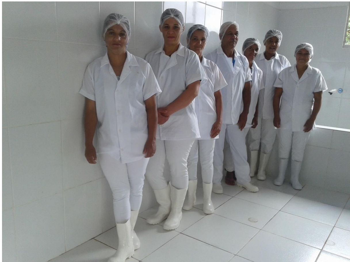
Grupo de produção