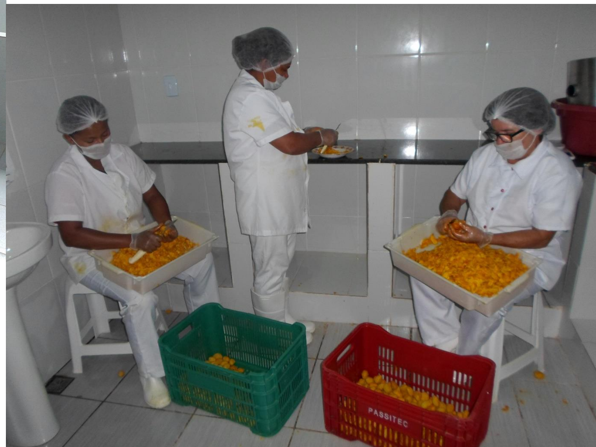
Processo de despola do pequi cozido