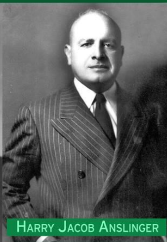
HARRY JACOB ANSLINGER