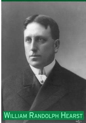
WILLIAM RANDOLPH HEARST