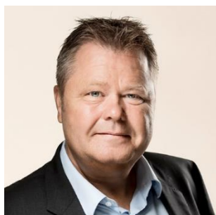
Sr. Henrik Møller (Partido Social Democrata)

É membro do Parlamento desde 2007. Foi presidente do Comitê de Assuntos Sociais entre 2016-2019 e também do Comitê de Imigração e Integração entre 2013-2015. É o supervisor da Biblioteca do Parlamento. Ao longo dos anos, esteve envolvido com outros cargos políticos na área da educação, cultura, igualdade de gênero e imigração e integração. Antes de ingressar na carreira política, Troels atuava como professor primário.