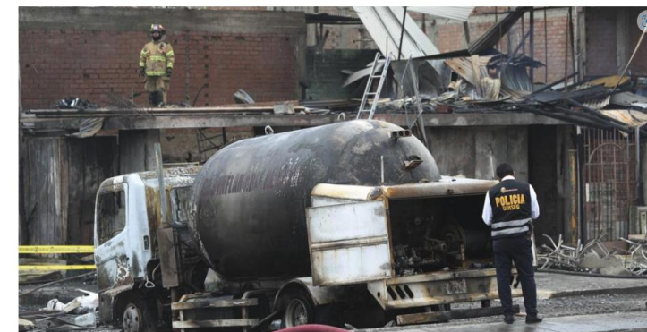
La policía trata de esclarecer las causas que provocaron la rotura en el tanque de gas

• Se produjo una fuga de gas después de que el vehículo pasara por un bache