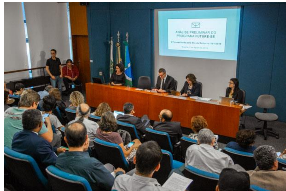
Reunião do Consuni, em 2 de agosto