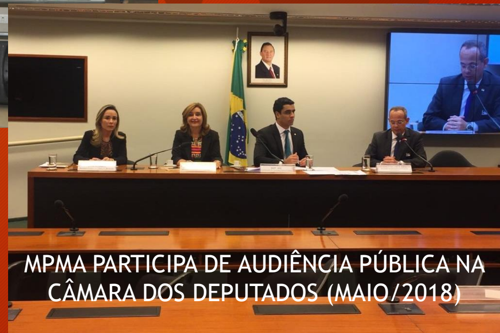
MPMA PARTICIPA DE AUDIÊNCIA PÚBLICA NA CÂMARA DOS DEPUTADOS (MAIO/2018)