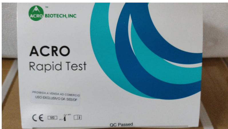
Figura 1 - Registro fotográfico do teste de COVID recebido. Processo nº 00060-00106136/2020-61

A fragilidade da etiqueta contendo o produto, sendo facilmente destacável, facilita os casos em que ocorram furtos dos testes rápidos, com sua posterior venda no comércio. A despeito da fragilidade da etiqueta, o produto foi recebido normalmente, conforme Atesto 52 (43102858) e Relatório Analítico SES/SVS/LACEN (43103124).