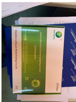
Figura 2 - Registro fotográfico do teste de COVID recebido. Processo nº 00060-00173692/2020-42

Além disso, para esse mesmo produto constava no Projeto Básico “ Apresentar o produto com a embalagem em perfeito estado, nas condições de temperatura exigidas no rótulo, sendo que todos os dados (rótulo) devem estar em português ”;. No processo consta uma cópia dos dados do produto (39712506), onde algumas informações não foram traduzidas, estando somente em inglês. Tal fato inclusive foi confirmado por meio da Solicitação de Informação nº 73/2020 – CDGF/SUBCI/COAUC/DAESP (44334031):