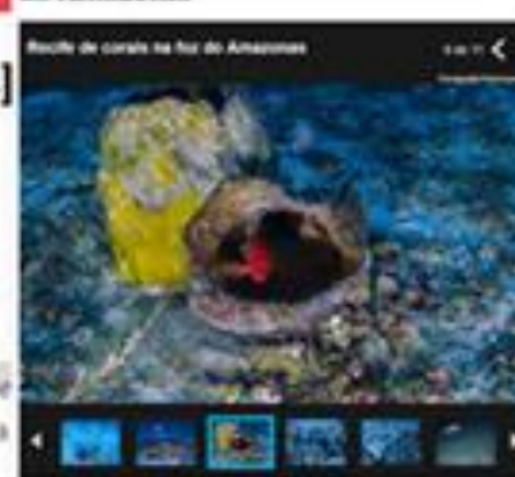
Recife de corais na foz do Amazonas

Divulgadas primeiras fotos dos corais da Amazônia