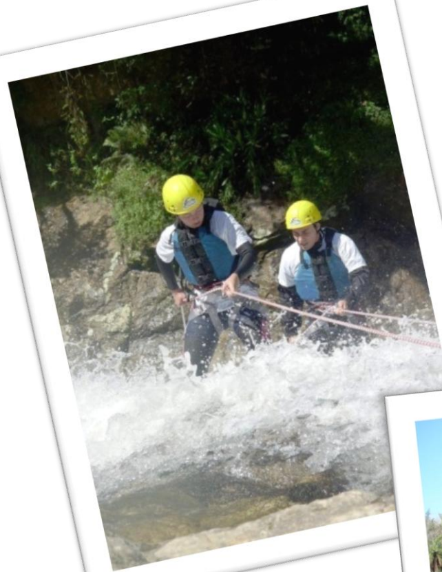
Turismo de Aventura