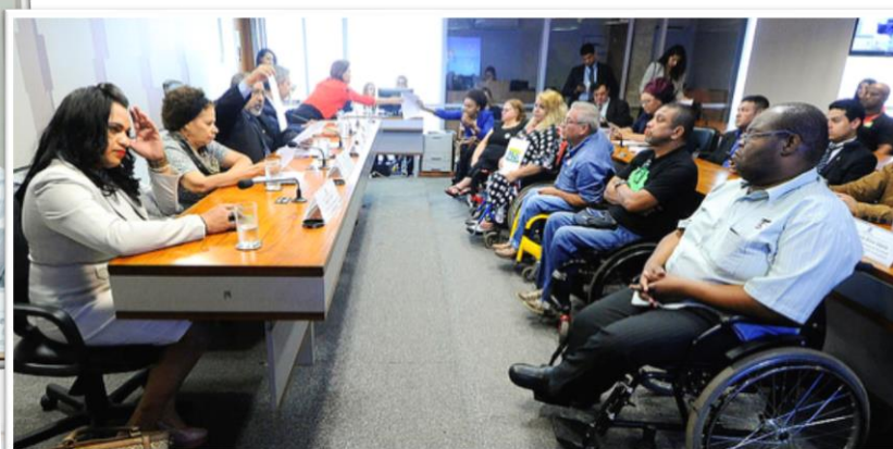
RE 84, 30/10/2017.