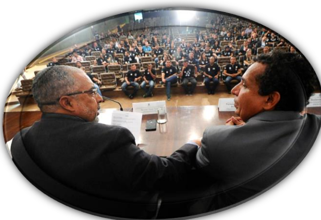
RE 89, 21/11/2017.