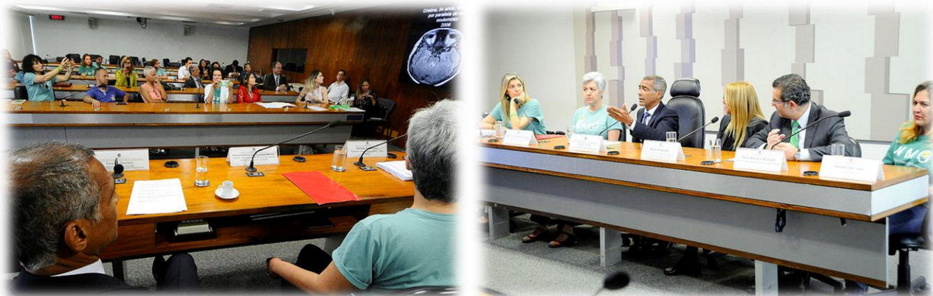
RE 102, 06/12/2017.