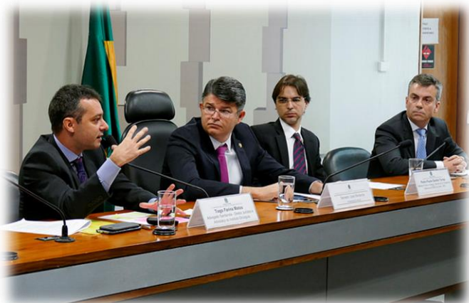
RE 66, 19/09/2017.