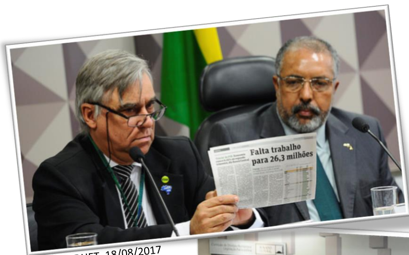
RE 02 CDHET, 18/08/2017