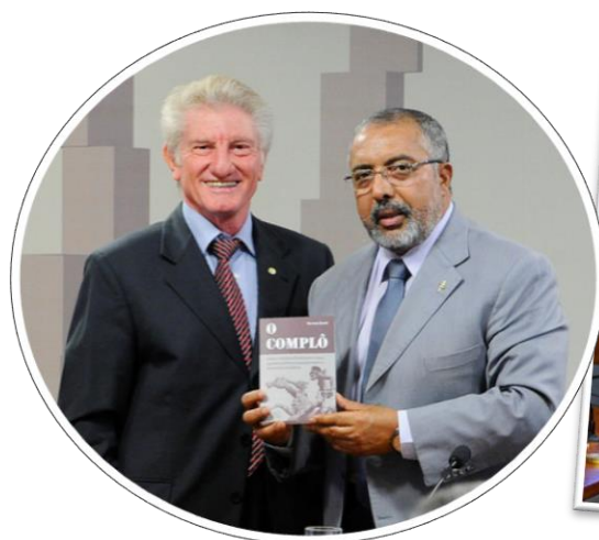
RE 97, 04/12/2017.