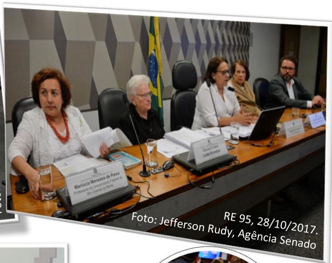
RE 95, 28/10/2017.