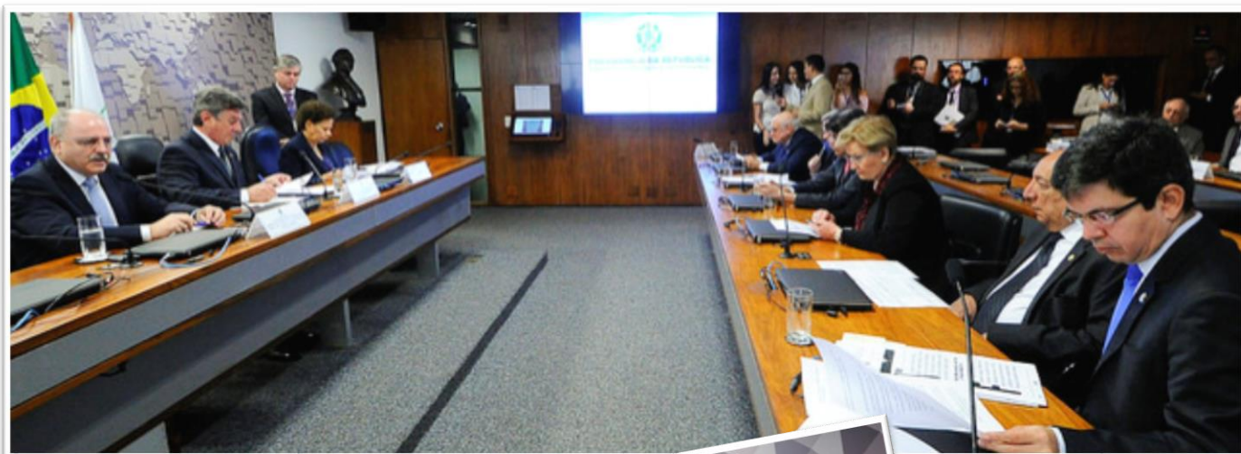
RE 55, 10/08/2017.