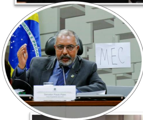
RE 103, 07/12/2017.