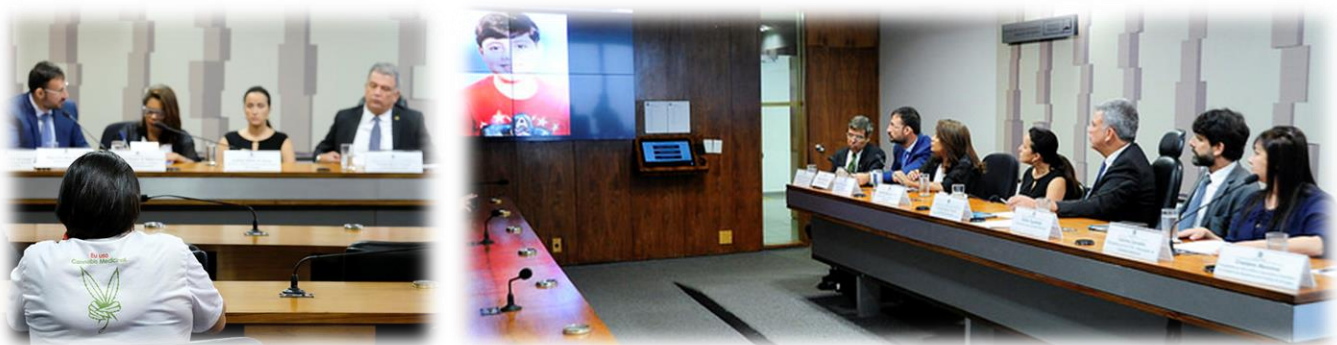
RE 83, 26/10/2017.