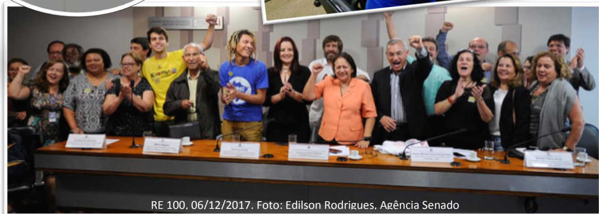
RE 100, 06/12/2017.