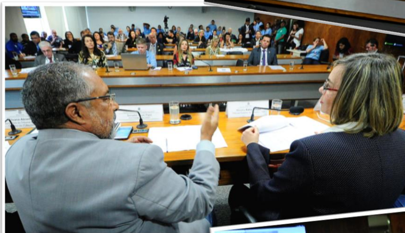
RE 09 CDHET, 06/11/2017