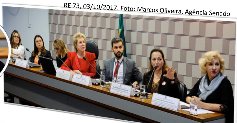
RE 73, 03/10/2017.