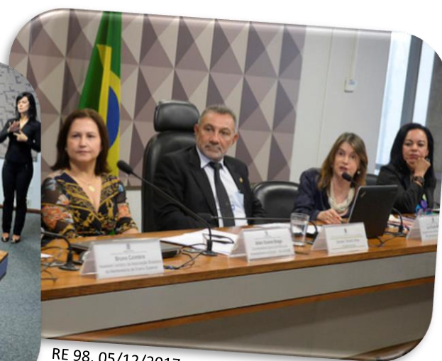
RE 98, 05/12/2017.