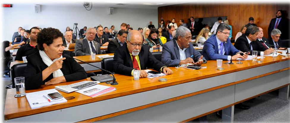
RE 49 e 51, 1º e 7/08/2017.