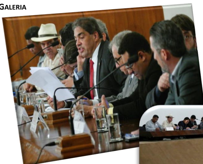
RE 106, 14/12/2017.