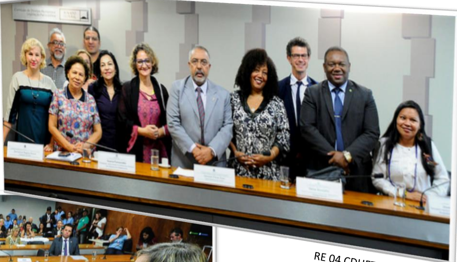
RE 04 CDHET, 11/09/2017