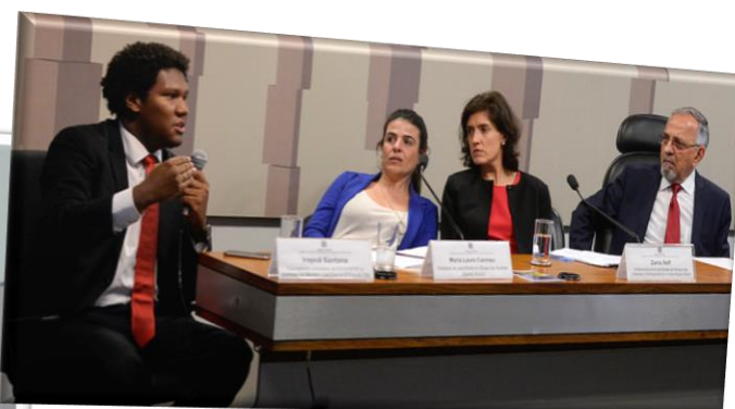
RE 81, 24/10/2017.