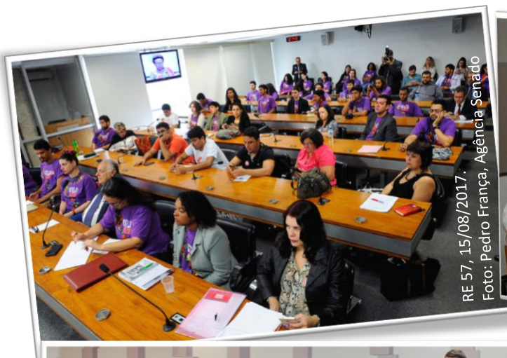
RE 57, 15/08/2017.