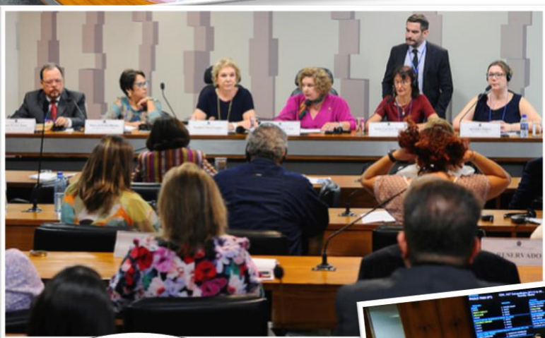
RE 82, 25/10/2017.