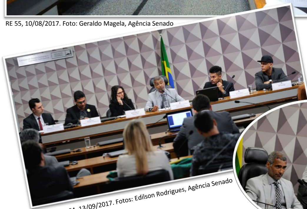
RE 64, 13/09/2017.