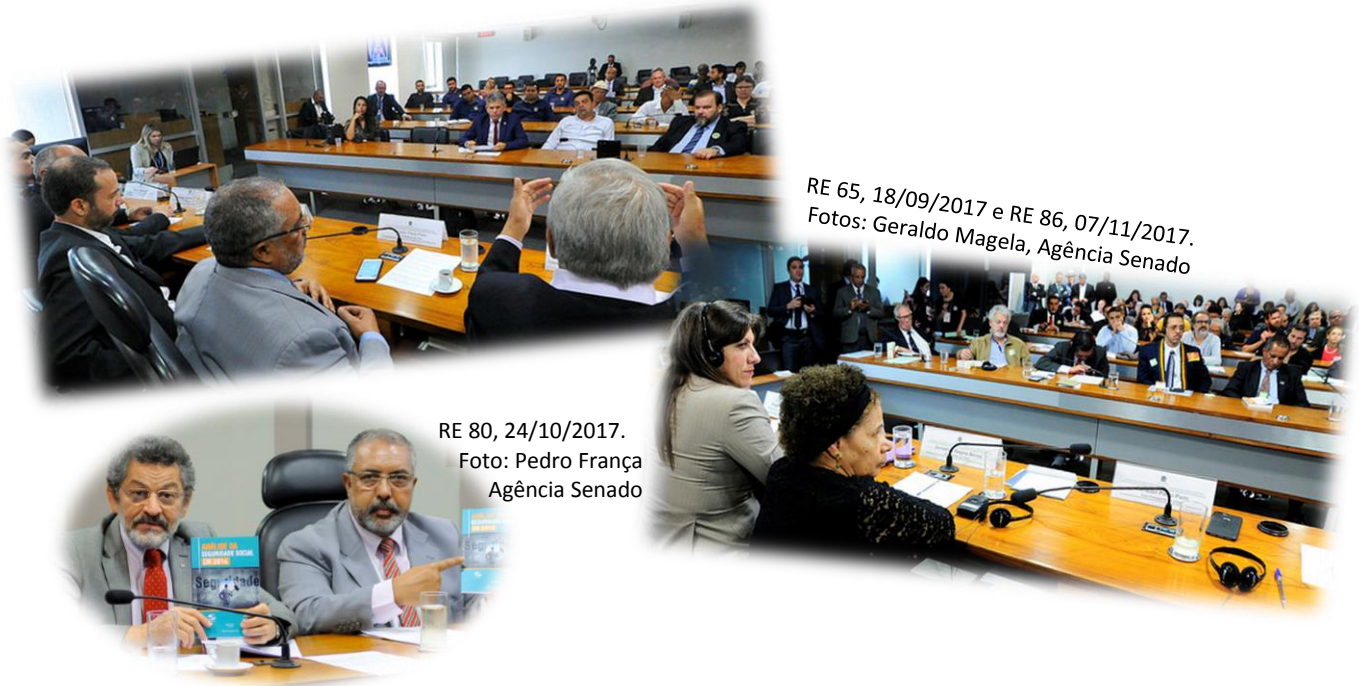
RE 65, 18/09/2017 e RE 86, 07/11/2017.