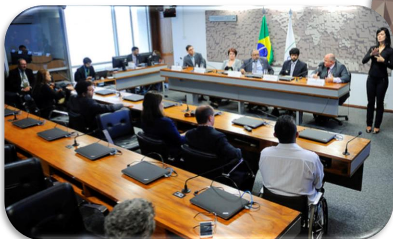
RE 99, 05/12/2017.