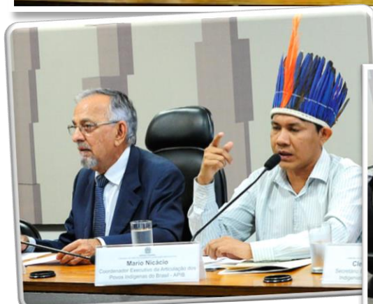
RE 85, 31/10/2017.