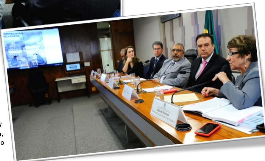
RE 10 CDHET, 20/11/2017