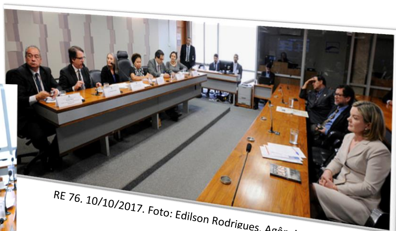
RE 76, 10/10/2017.