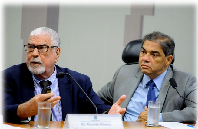
RF 70, 28/09/2017.