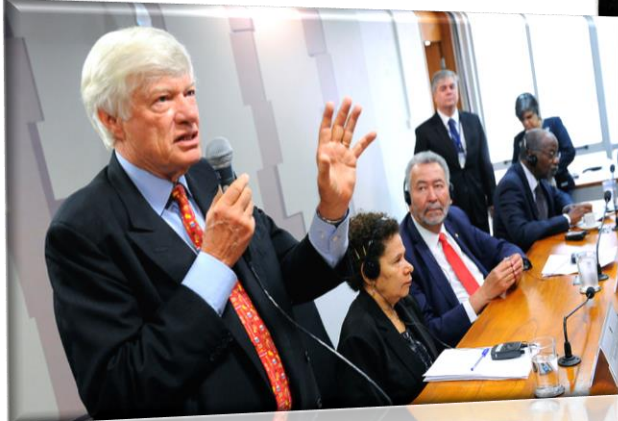
RE 62, 30/08/2017.