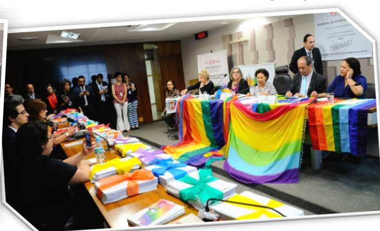
Ato de entrega do Estatuto da Diversidade Sexual, 23/11/2017.