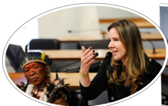
RE 56, 10/08/2017.