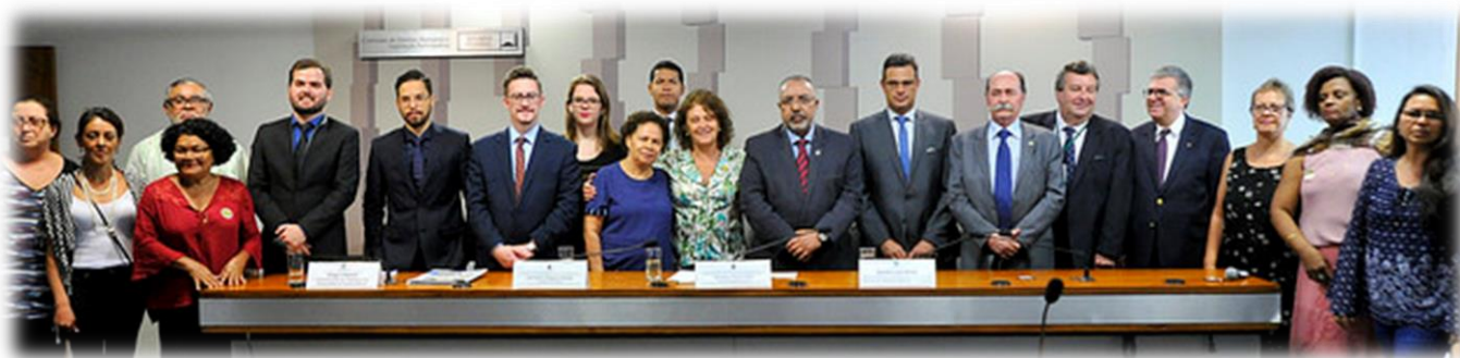
RE 71, 02/10/2017.