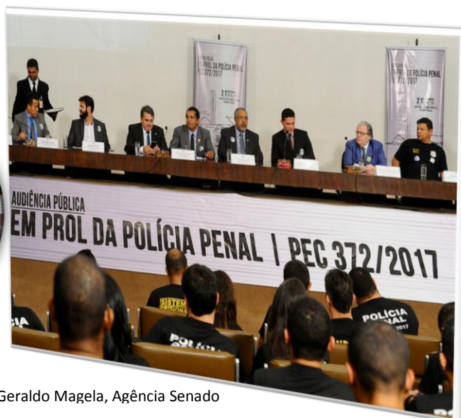
RE 90, 21/11/2017.