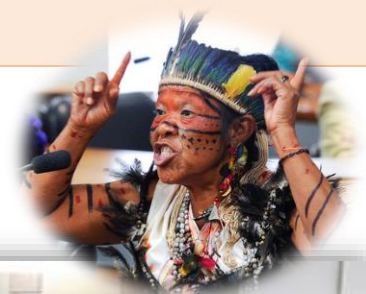
RE 56, 10/08/2017.