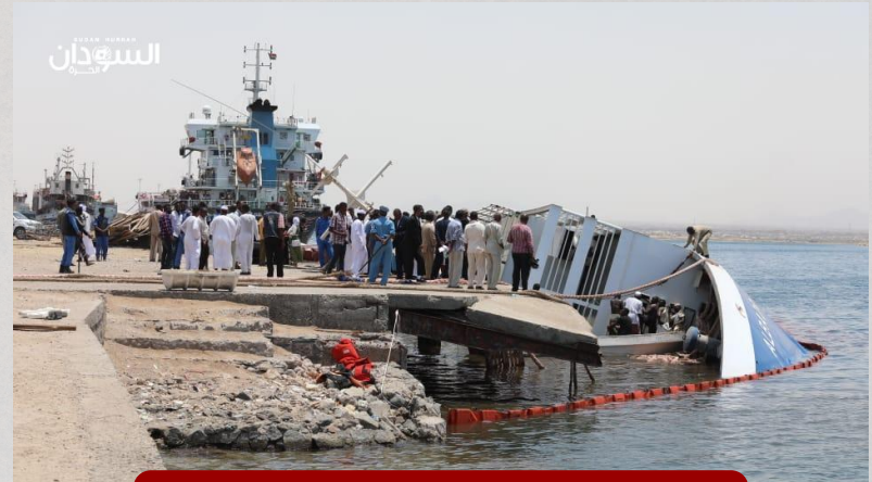
Al Badri 1, Sudão, 2022