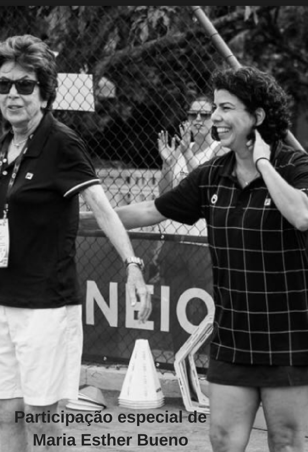
Participação especial de Maria Esther Bueno