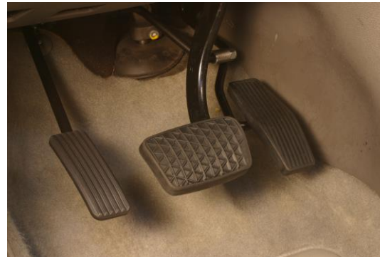
Inversão do pedal do acelerador