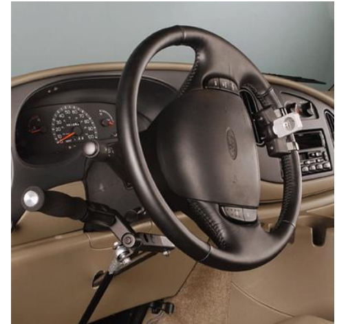
Comandos manuais de freio e acelerador