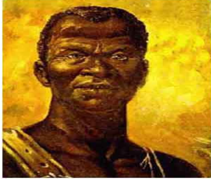
Zumbi dos Palmares