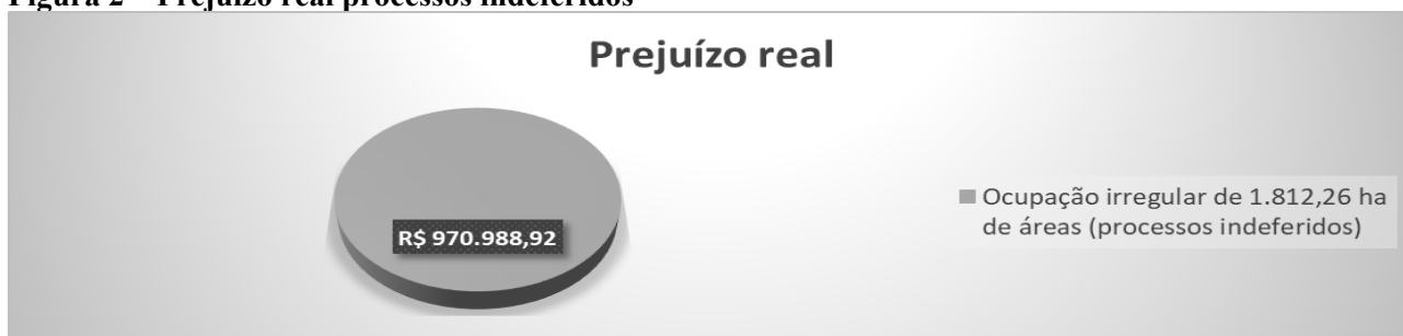
Figura 2 – Prejuízo real processos indeferidos

indeferidos (Apêndice S), bem como o desmatamento em quatro áreas geosensoriadas, no total de 455,07 ha (Apêndice Q).